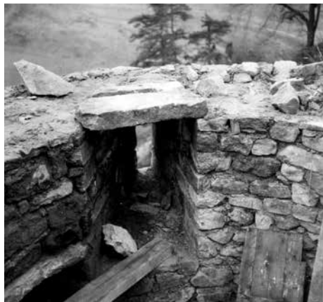
Obr. 15. Hrad Zvíkov, okres Písek. Výstavba horní části bašty na východním nároží hlavní hradby severního nádvoří na konci 50. let minulého století. Podle Fuka b. d.

Abb. 14. Burg Zvíkov, Bezirk Písek. Zerlegter oberer Teil der Bastei an der Ostecke der Hauptwehrmauer des Nordhofes Ende der fünfziger Jahre des vergangenen Jahrhunderts. Nach Fuka b. d.