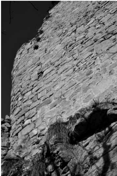
Obr. 8. Hrad Zvíkov, okres Písek. Věžice na severozápadním nároží a navazující úsek západní hlavní hradby s řádkovaným zdivem a s obnoveným cimbuřím. Foto J. Varhaník, 2015. Abb. 8. Burg Zvíkov, Bezirk Písek. Schalenturm in der Nordwestecke und anschließender Abschnitt der westlichen Hauptwehrmauer mit im Läuferverband errichtetem Mauerwerk und wiederhergestellter Zinne. Foto J. Varhaník, 2015

Na nárožní věžici tangenciálně navazuje přímý západní úsek hradby o délce 25 m, směřující jihovýchodním směrem (obr. 8). Na severní části tohoto úseku hradby na jeho patě předstupuje velice nepravidelný předzáklad. Zejména ve spodní části líce nad touto partií převažuje řádkované zdivo z hrubě opracovaných kvádrů. Koruna tohoto úseku hradby je opatřena cimbuřím s šesti stínkami, opatřenými dovnitř sklopenými pultovými stříškami krytými prejzy. Tři proluky cimbuří od jihu jsou hlubší než předchozí. Převážně řádkované, při opravě hradu nově vyspárované zdivo stoupá na vnějším líci hradby až do stínek cimbuří. Vyobrazení hradu od Steithaue- ra a Wolfa z přelomu 18. a 19. století (Libal 1955, 3) v těchto místech poškozené cimbuří zachycuje, bylo tedy jen v nevelkém rozsahu novodobě doplněno. Výška tohoto úseku hradby po vrchol stínek cimbuří činí 10 m nad vnějším terénem. Jižní část hradby je v délce 6 m opatřena vysokým skarpem. Na jihu se těsně vedle skarpu hradba tupouhle zalamuje