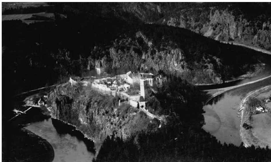
Obr. 1. Hrad Zvíkov, okres Písek. Letecký pohled od jihu z roku 1922.