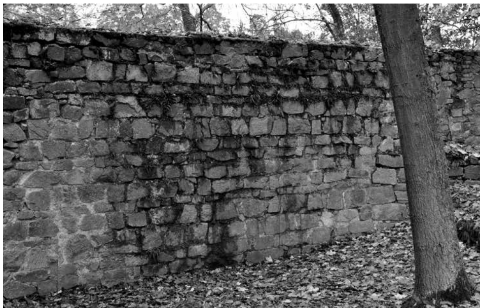
Obr. 10. Hrad Zvíkov, okres Písek. Vnitřní líc hlavní hrady severního nádvoří mezi severozápadním nárožím a Červenou věží. Foto J. Varhaník, 2012.