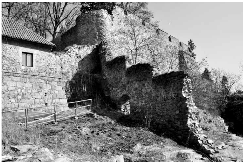
Obr. 7. Hrad Zvíkov, okres Písek. Věžice na severozápadním nároží hlavní hradby. Vlevo se napojuje parkánová hradba, vpravo úsek hradby podhradí, jehož poslední část byla zničena havárií. Foto J. Varhaník, 2012.