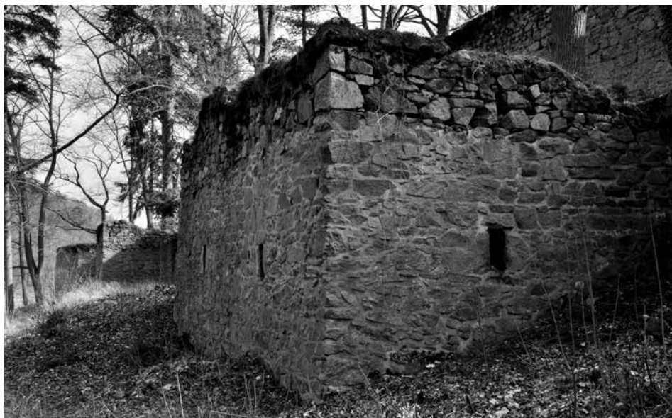
Obr. 6. Hrad Zvíkov, okres Písek. Bašty parkánové hradby se šterbinovými střílnami pro hákovnice. Před nimi se uplatňuje rozměrná berma.