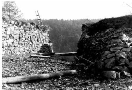
Obr. 14. Hrad Zvíkov, okres Písek. Zrozebraná horní část bašty na východním nároží hlavní hradby severního nádvoří na konci 50. let minulého století. Podle Fuka b. d.

Dále k východu je hradba mírně vychýlena a vzeprěna rozměrným skarpem. Za ním východním směrem je hradba opatřena drobnými drenážními otvory, patrnými ve vnějším lici zdiva. Struktura líce zdiva je heterogenní, převážně prováděná po vrstvách z lomového zdiva. Místy se vyskytují jen velmi hrubě opracované kvádry o výšce až 40–50 cm. V horní části líce se zde uplatňují otvory po samonosném lešení a několik čtvercových kapes pod korunou hradby, jejich