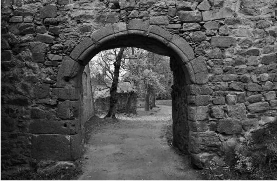
Obr. 18. Hrad Zvíkov, okres Písek. Brána v „Pláští“ od jihu. Foto J. Varhaník, 2014.