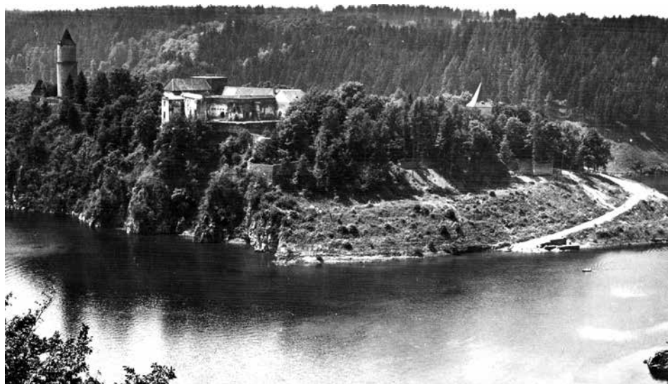
Obr. 3. Hrad Zvíkov, okres Písek. Pohled od severu na částečně zatopené podhradí v roce 1961. Nad úroveň hladiny přehradního jezera jsou patrné pozůstatky zdiva kostela sv. Mikuláše, výše ve svahu je zřetelná linie valu na místě laténské hradby a nad ním berma před parkánovou hradbou.

Dílčí záchranné výzkumy byly prováděny v souvislosti s památkovými úpravami královského paláce v 70. letech minulého století, k poznání stavebního vývoje hradu však nepřispěly (Michálek 1973). Nevelký záchranný výzkum byl na hradě proveden v roce 2008 (Havlice 2008).