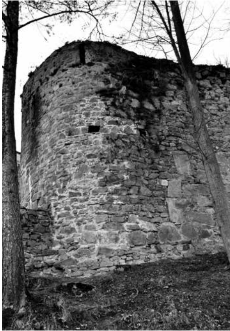
Obr. 16. Hrad Zvíkov, okres Písek. Okrouhlá bašta na východním nároží hlavní hradby severního nádvoří.

otvírající se navenek trojicí šachovnicovitě rozmístěných šterbinových, dovnitř se rozšiřujících střílen v obvodní zdi silné 1,5 m (Fuka b. d.). Jejich ostění jsou vyzděna z lomového kamene (obr. 15). Současný stav objektu by tedy bylo možné charakterizovat spíše jako baštu než jako věžici. Projekt rekonstrukce horní části této bašty údajně nevycházel z nálezové situace, ale z podoby střílen na jiných hradech (!). 3 Zcela nový je také obdélný portálek, jímž je tento prostor, krytý železobetonovým stropem, přístupný ze severního nádvoří. Patrně se již nepodaří zjistit,