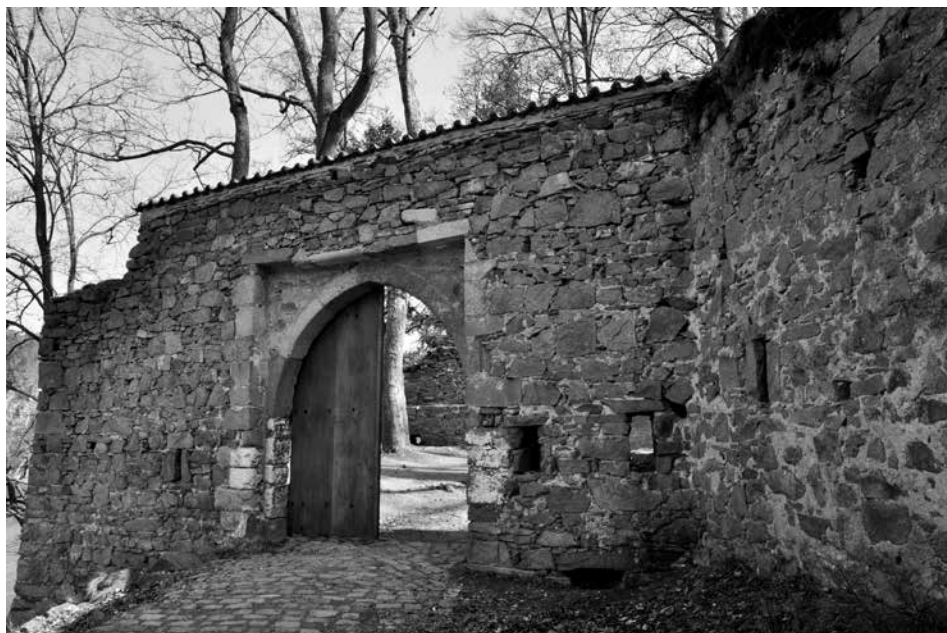
Obr. 5. Hrad Zvíkov, okres Písek. Dolní brána v druhé baště parkánové hradby od západu. Záklenek ostění a zdivo nad ním vykazují stopy pozdějšího přezdění. Foto J. Varhaník, 2012.

Abb. 4. Burg Zvíkov, Bezirk Písek. Deutlich von Erosion gezeichnete Böschung im Vorfeld der Zwingermauer. Die bei einer archäologischen Grabung in den fünfziger Jahren des vergangenen Jahrhunderts entdeckten Wallreste und ältere latènezeitliche Wehrmauer sind nicht sichtbar. Im Hintergrund erhebt sich deutlich die Berme vor der Zwingermauer. Foto J. Varhaník, 2012.