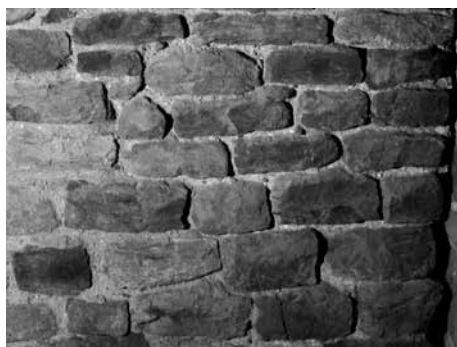
Obr. 11. Bernartice, okres Písek. Líc románského zdiva v interiéru západní věže kostela sv. Martina dodatečně připojené k lodi po roce 1223. Foto J. Varhaník, 2009.