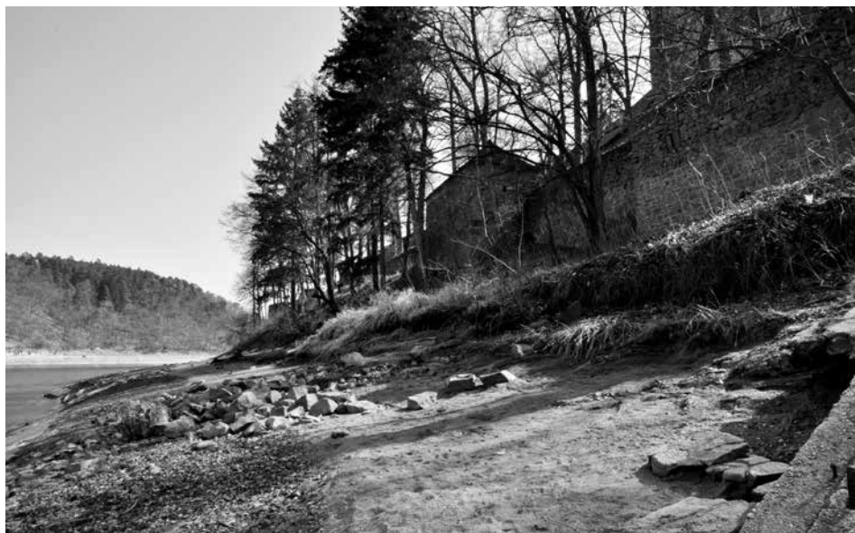
Obr. 4. Hrad Zvíkov, okres Písek. Svah výrazně poznamenaný erozí v předpolí parkánové hradby. Pozůstatky valu a starší laténské hradby zjištěné archeologickým výzkumem v 50. letech minulého století nejsou patrné. V pozadí vystupuje výrazná berma před parkánovou hradbou. Foto J. Varhaník, 2012.

Abb. 4. Burg Zvíkov, Bezirk Písek. Deutlich von Erosion gezeichnete Böschung im Vorfeld der Zwingermauer. Die bei einer archäologischen Grabung in den fünfziger Jahren des vergangenen Jahrhunderts entdeckten Wallreste und ältere latènezeitliche Wehrmauer sind nicht sichtbar. Im Hintergrund erhebt sich deutlich die Berme vor der Zwingermauer. Foto J. Varhaník, 2012.