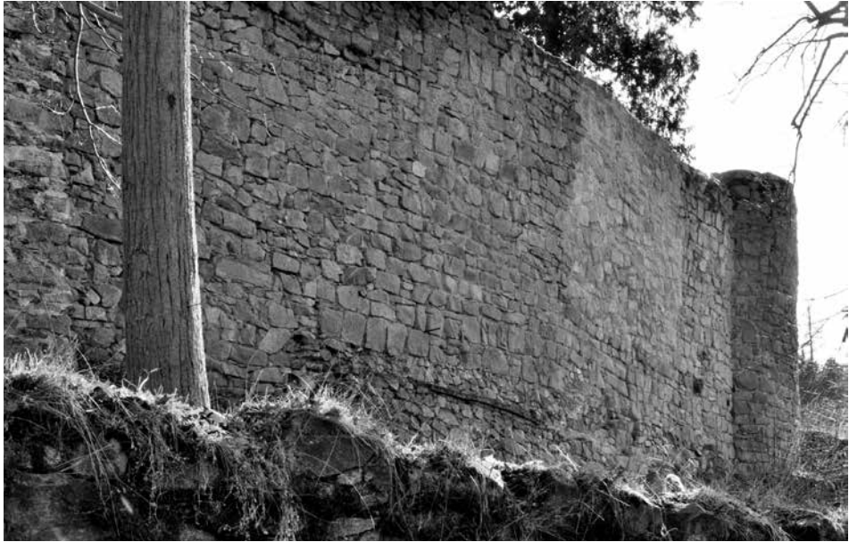
Obr. 9. Hrad Zvíkov, okres Písek. Úsek hlavní hradby severního nádvoří s převážně kvádřovým lícem, navazující na nárožní severozápadní věžici. V popředí snížená parkánová hradba. Foto J. Varhaník, 2015.

Abb. 9. Burg Zvíkov, Bezirk Písek. Abschnitt der Hauptwehrmauer des Nordhofes mit überwiegender Quaderflucht, die an die Ecke des nordwestlichen Schanzenturms anschließt. Im Vordergrund abgesenkte Zwingermauer. Foto J. Varhaník, 2015.