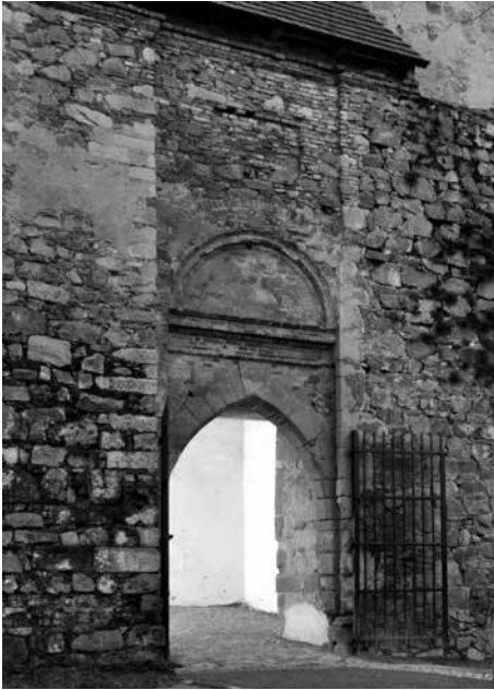
Obr. 12. Hrad Zvíkov, okres Písek. Železná brána v severní hradbě. Horní část brány a opěrák vlevo, obsahující velký počet raně gotických architektonických článků, pocházejí z barokní úpravy v roce 1710. Foto J. Varhaník, 2015.

Abb. 12. Burg Zvíkov, Bezirk Písek. Eisentor in der nördlichen Wehrmauer. Der obere Teil des Tores und der Stützpfeiler links stammen vom barocken Umbau aus dem Jahr 1710 und enthalten eine Fülle von frühgotischen architektonischen Elementen. Foto J. Varhaník, 2015.