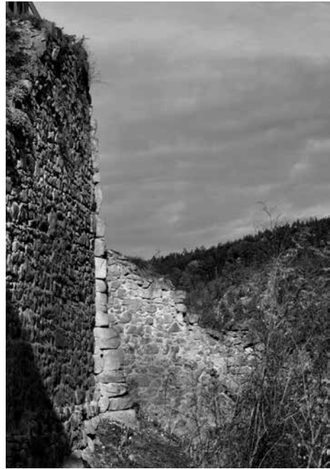
Obr. 17. Hrad Zvíkov, okres Písek. Vlevo východní hradba parkánu, za ní vystupuje armatura jihovýchodního nároží štítové zdi „Pláště“. Na její spodní část se napojuje příčná zeď pravděpodobně z 15. století, jež nedovoluje obejít patu hradeb.

zda rekonstrukce alespoň co do velikosti interiéru respektovala stopy původního řešení, které se podařilo po vyklizení zříceného zdiva odkrýt, či zda jde o ničím neodůvodněný novotvar. Rovněž není známo, zda spodní část objektu je plná, či zda neobsahuje zasypanou dutinu. Na vnějším líci zdiva bašty se na severní straně uplatňují přibližně nad polovinou její výšky dva čtverhranné otvory, situované v téže výši (obr. 16). Není vyloučeno, že v nich byly ukotveny nosníky samonosného lešení, ovšem jejich větší rozměry by mohly poukazovat spíše na to, že jde o stopy po vyhníklých dřevěných kleštinách, které měly fixovat zdivo bašty. Výška zdiva bašty, stejně jako sousední hradby, činí na severní straně 7,7 m nad terénem, poměrně strmě spadajícím k parkánové hradbě. Na úpatí bašty vyčnívá nad úroveň terénu nepravidelný předzáklad. Skladba líce zdiva bašty se podstatně liší od relativně pravidelného, převážně řádkovaného zdiva západní věžice. Obdobné deformace jejich půdorysu by však mohly poukazovat na to, že obě stavby byly součástí téhož záměru.