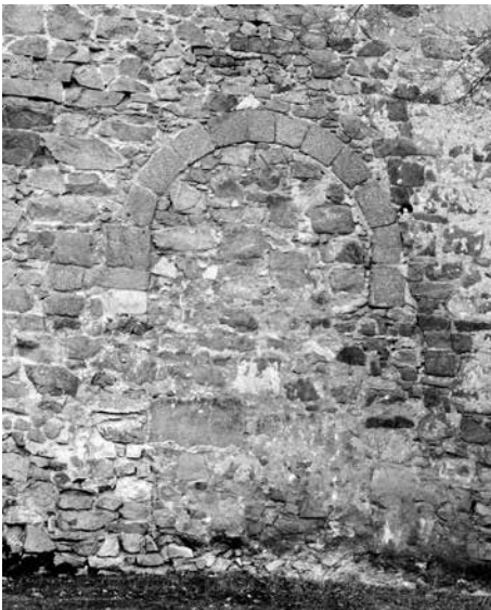
Obr. 13. Hrad Zvíkov, okres Písek. Zazděná brána v hlavní hradbě severního nádvoří. Foto J. Varhaník, 2015.

Abb. 12. Burg Zvíkov, Bezirk Písek. Eisentor in der nördlichen Wehrmauer. Der obere Teil des Tores und der Stützpfeiler links stammen vom barocken Umbau aus dem Jahr 1710 und enthalten eine Fülle von frühgotischen architektonischen Elementen. Foto J. Varhaník, 2015.