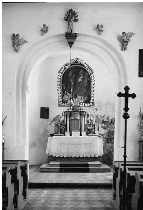
Obr. 11. Staré Hvězdlice, okr. Vyškov, kostel Všech svatých. Pohled z lodi do apsidy, 40. léta 20. století.

Abb. 11. Staré Hvězdlice, Bez. Vyškov, Allerheiligenkirche. Blick vom Kirchenschiff in die Apsis, vierziger Jahre 20. Jhdt.