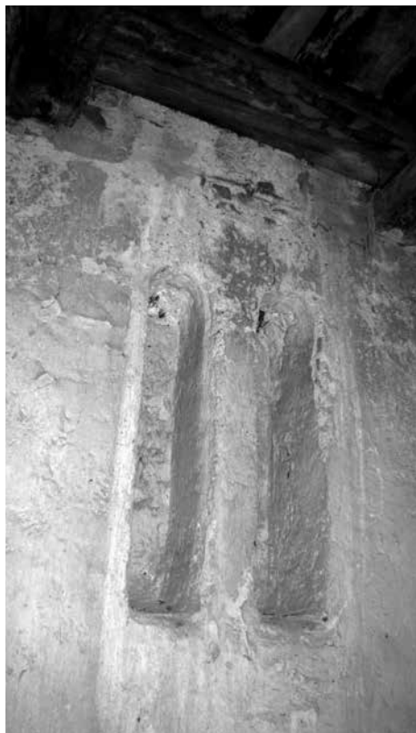
Abb. 9. Staré Hvězdlice, Bez. Vyškov, Allerheiligenkirche. Detail eines Sägezahnfriessfragments in der Ostwand des Turms. Foto P. Dohnalová, 2012.

pravidelně oblým záklenkem. Okno je děleno zmíněným stropem a v úrovni jeho záklenku jsou ve zdivu patrné dvě symetricky umístěné kapsy po dřevěných trámech (?).