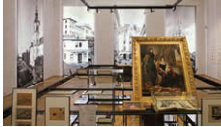
Abb. 9: Blick in den Bereich „Die explodierende Stadt 1809-1914“ der Schausammlung „360Graz“ im GrazMuseum.