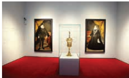
Abb. 12: Blick in die Schausammlung des „Museum im Palais“ in Graz mit dem Titel „Statussymbole“.

ein Museum in Bewegung“ 54 zur Folge haben. Deshalb befindet sich die Hälfte der im Jahr 2013 eröffneten Schau- und Sonderausstellungsräume „in einem kontinuierlichen Veränderungsprozess, um durch immer wieder neue Themenstellungen die riesigen Sammlungsbestände bestmöglich nutzen zu können, aber auch auf neue Entwicklungen und die Gesellschaft beschäftigende Fragestellungen antworten zu können.“ 55