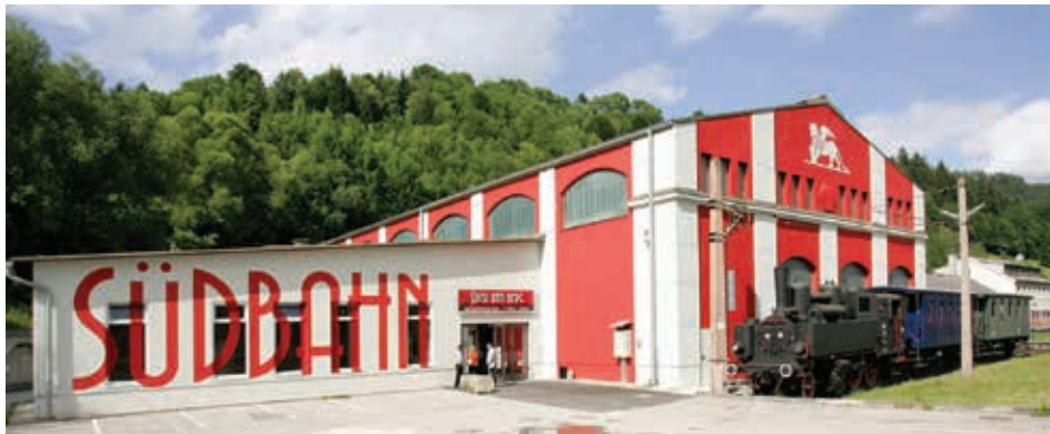
Abb. 3: Außenansicht der ehemaligen „Neuen Montierung“ (1919) des als „Innenraum-Museum“ genutzten Bereichs des „SÜDBAHN Museum Mürrzuschlag“.

Gleichzeitig wird die museale Präsentation sowohl durch Sonderausstellungen – durchaus mit Eventcharakter – als auch durch museale Interpretation 38 erweitert. Sonderfahrten mit historischen Lokomotiven und Wagengarnituren, Kinder- und Familienfeste, Flohmärkte beziehungsweise Tauschmärkte, die als Sonder-