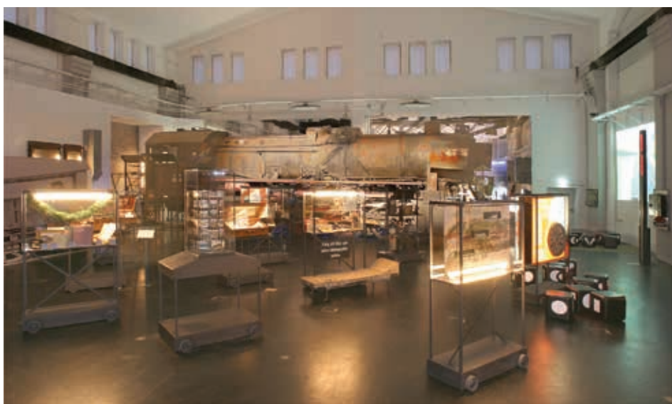
Abb. 5: Blick in die Haupthalle des Stammhauses des „SÜDBAHN Museum Mürrzuschlag“ (Neue Montierung) mit dem Bereich: „Wirkungsgeschichte“.