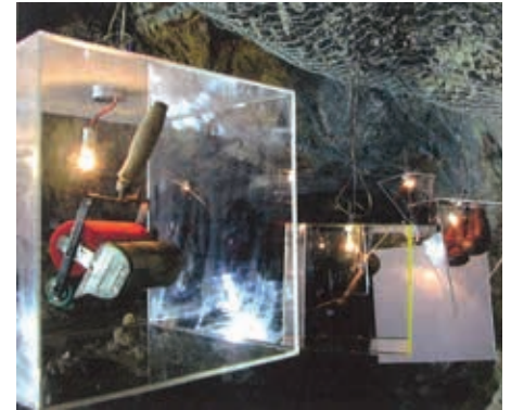
Abb. 1: Blick in einen der Ausstellungsräume im Stollensystem des Schlossberges im Rahmen der Ausstellung „Berg der Erinnerungen“. Bildnachweis: HOFGARTNER, Heimo, Katia SCHURL und Karl STOCKER. Berg der Erinnerungen. Die Geschichte der Stadt ist die Geschichte ihrer Menschen. Katalog zur Ausstellung im Stollensystem des Grazer Schloßberges (22. März bis 28. September 2003), Graz 2003, S. 17.

quellenwissenschaftlichen Forschung und der daraus resultierenden musealen Vermittlung beschäftigt, zu den größten Herausforderungen der Disziplin. Die lapidare Reduktion auf Anwendungsorientierung ohne Rückkopplung zu theoretischen Modellen ist ebenso fehlgeleitet wie – umgekehrt – theoretische Konzepte nicht umsetzbar sind, wenn diese den alltäglichen Sachzwängen der Museumsarbeit und den Besucherbedürfnissen nicht gerecht werden.