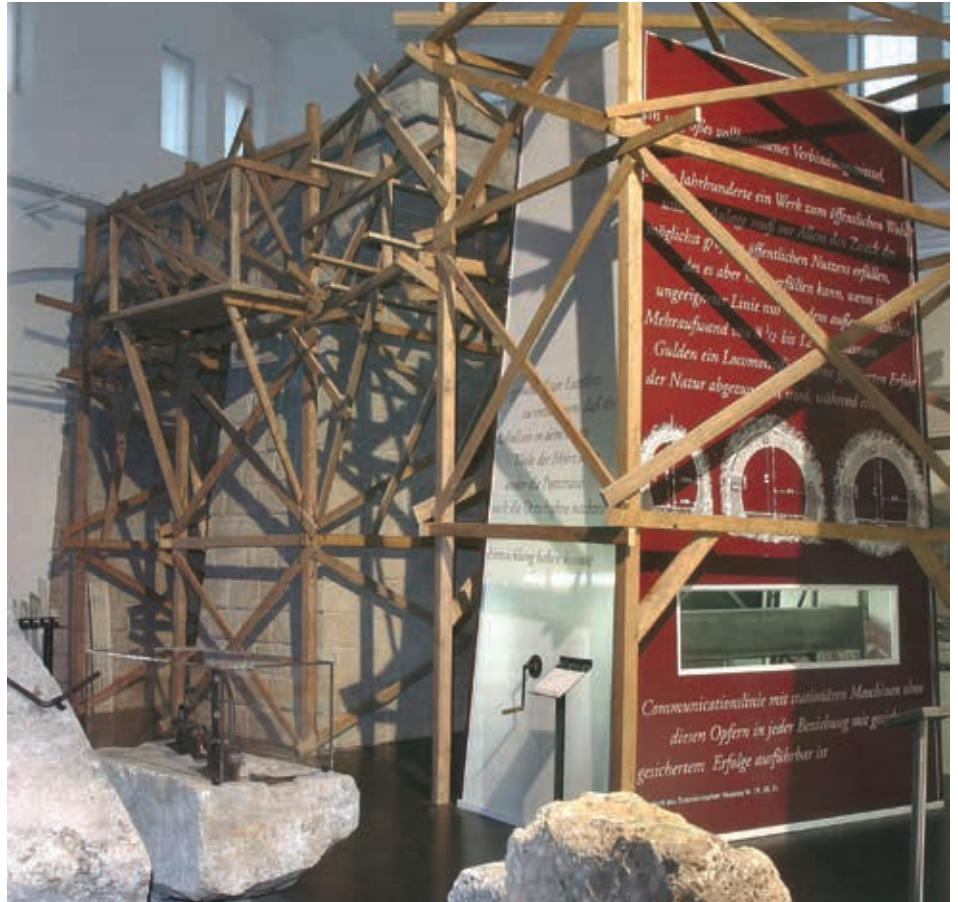
Abb. 6: Blick in die Haupthalle der ehemaligen Neuen Montierung auf den Nachbau der Semmering-Baustelle.

Als drittes Beispiel, das neue Blickwinkel auf museale Präsentationen und Interaktivität bietet, dient die im Jahr 2012 neu konzipierte und eröffnete Schausammlung des Stadtmuseums Graz mit dem Titel „360°Graz“. 40 Die Geschichte der Stadt wird chronologisch in vier Themenbereiche eingeteilt: die „geschlossene Stadt 1128-1600“, „die offene Stadt 1600-1809“, „die explodierende Stadt 1809-1914“ und die „suburbanisierte Stadt 1914 – heute“. Weitere Ebenen, die in den jeweiligen Themenschwerpunkten dargestellt werden, umfassen „die Gestalt