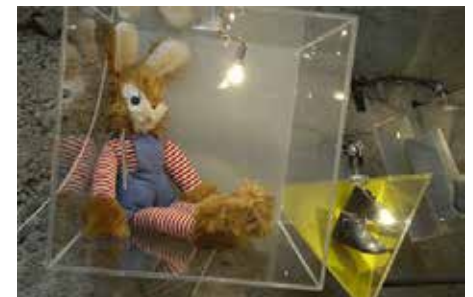
Abb. 2: Erinnerungsobjekt in einer Vitrine im Rahmen der Ausstellung „Berg der Erinnerungen“.

Das seit dem Jahr 2007 als „SÜDBAHN Museum Mürrzuslag“ bezeichnete „Innenraum-Museum“ befindet sich unmittelbar an der seit 1844 hier befahrenen Südbahn. (Abb. 2)