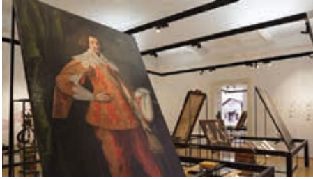
Abb. 8: Blick in den Bereich „Die offene Stadt 1600-1809“ der Schausammlung „360Graz“ im GrazMuseum.