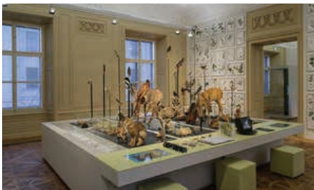
Abb. 11: Blick in den Bereich „Biowissenschaften“ im Naturkundemuseum des Universalmuseum Joanneum.