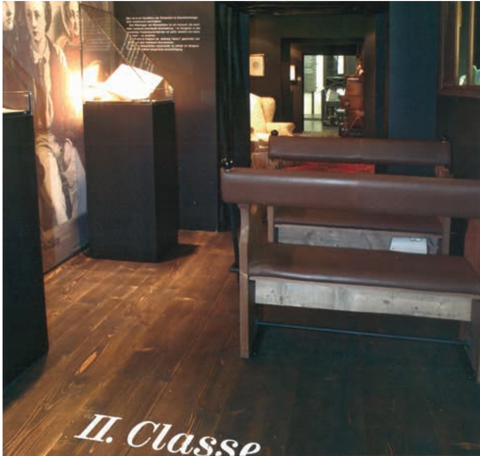
Abb. 7: Blick in die Flucht nachempfundener Personenwagen der zweiten, ersten und dritten Klasse.

zeigt keine geschönte Fassade, sondern „Schlüsselobjekte“ 47 und Interpretationen, womit die Besucherinnen und Besucher zu „Regisseuren“ 48 des Museums werden. Sie sind eingeladen, sich selbst ihr Bild zu machen und ihren Reim darauf, wie Graz geworden ist, wie es ist. 49 Diese Schausammlung charakterisiert paradigmatisch jene zuvor angesprochenen Problemfelder der aktuellen partizipatorischen Phase des musealen Ausstellungswesens. Auf diese Weise kann es insbesondere zu Fehlinterpretationen kommen, da Besucherinnen und Besucher mit ihren Deutungen alleine gelassen werden.