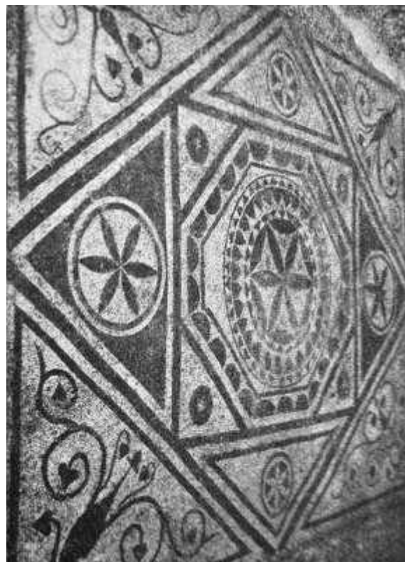
Archeologické vykopávky v jižní Dalmácii (obr. příloha ČJL I, 1930–1931, s. 128)