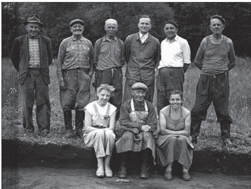
Obr. 1. První pracovní tým na Pohansku.