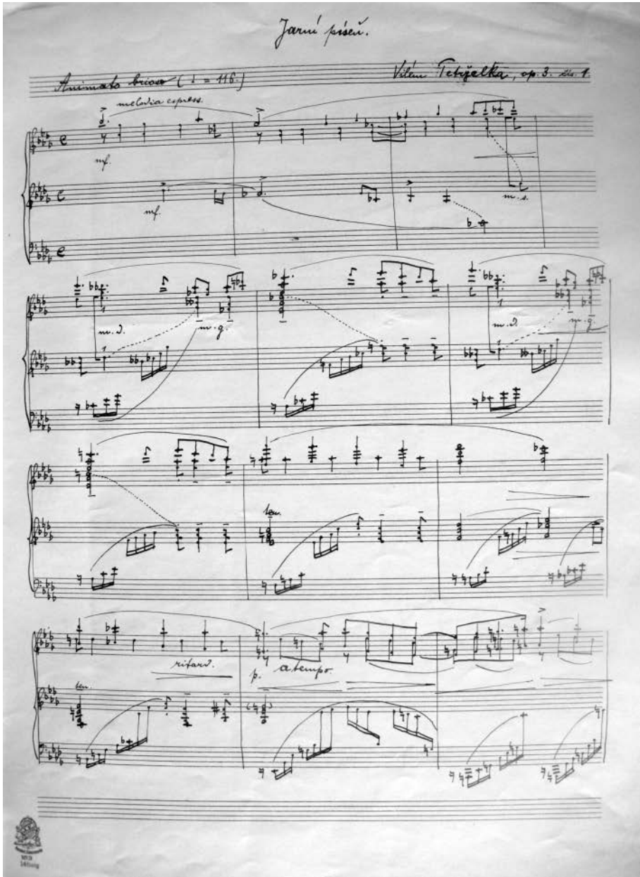
Obr. 1. První strana Petřelkova autografu Jarní píseň . Uloženo v ODH MZM, sine sign.