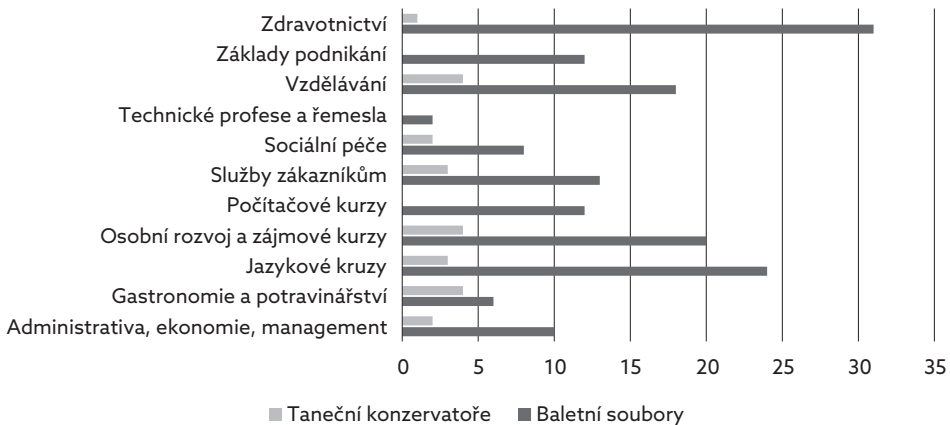
Graf 1: Netaneční oblasti jako předmět rekvalifikačních kurzů

V otázce, zda by ocenili zprostředkování kolektivních kurzů, kterých bych se účastnil celý soubor, volili tanečníci téměř v polovině případů kurzy v podobě seminářů zaměřených na rozšiřování tanečních dovedností. 27 % dotazovaných by ocenilo kurzy v podobě výukových programů zaměřených na získávání znalostí z netanečních oborů a 27 % dotazovaných by kolektivní kurzy spíše nevyužilo. V návaznosti na předchozí dvě otázky si mohli tanečníci i studenti vybrat z palety netanečních oblastí ty, které by je zajímaly a kterým by se chtěli věnovat v rámci svých rekvalifikačních či kolektivních kurzů. Následující graf znázorňuje jejich preference.