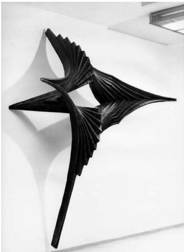
5 – Antonín Gajdušek, plastika v hale Centroprojektu Gottwaldov , 1969. Pozůstalost autora

komisí závazný právní rámec. 49 Zápisové knihy komise pro spolupráci architekta s výtvarníkem se zachovaly pro tuto dobu také v ostravské pobožce. 50