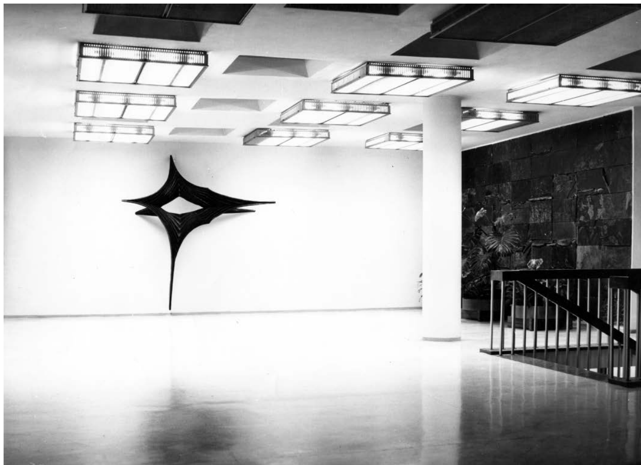
4 – Interiér haly Centropjektu Gottwaldov, 1969.

Zakládání komisí pro spolupráci výtvarníka s architektem navázalo na starší praxi. 42 Dosud není objasněno, zda tyto nejstarší komise fungovaly už od založení ČFVU a podniku Dílo, tedy od roku 1954. Nejstarší nalezené kontinuální zápisy z jednání komisí, vedené od roku 1956, můžeme sledovat v pražské pobočce archivního fondu ČFVU, ze zmínek víme, že schvalování v tomto roce probíhalo i v Ostravě, 43 kde od roku 1955 vhodnost monumentálních zakázek i jejich rozpočty řešil jiný subjekt než ČFVU, a to výbor krajského střediska Svazu československých výtvarných umělců. 44 Stejný orgán schvaloval realizace pro architekturu i v Brně. 45 Zápisy samotné umělecké komise ČFVU v Brně známe až z roku 1961, 46 kontinuálně se zachovaly od roku 1962. Tímto rokem začíná i série zápisů z gottwaldovské (zlínské) 47 a ústecké 48 pobočky, což zřejmě souvisí s uplatněním vyhlášky č. 149/1961, která dala činnosti uměleckých