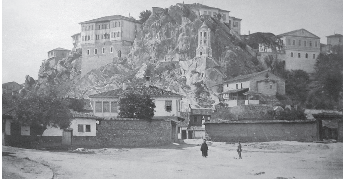
Plovdiv v roce 1880, pohled na jeden ze sedmi plovdivských vrchů, tzv. „tepet“