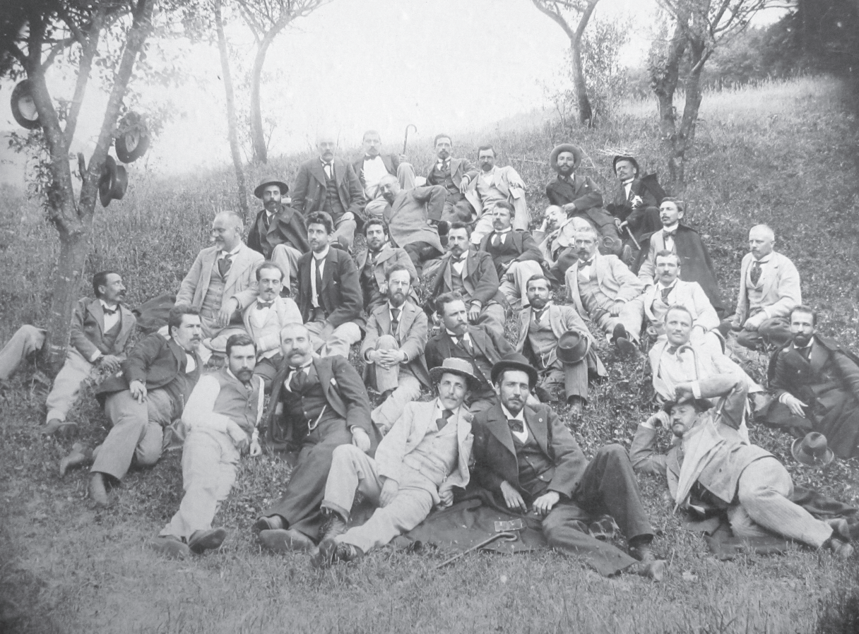
Učitel'ský sbor gymnázia v Gabrovu, snímek z výletu z roku 1900.

deckém diskurzu používá označení česká invaze do Bulharska. Mluví se také o civilizační úloze Čechů 1 v nově vzniklém státě.