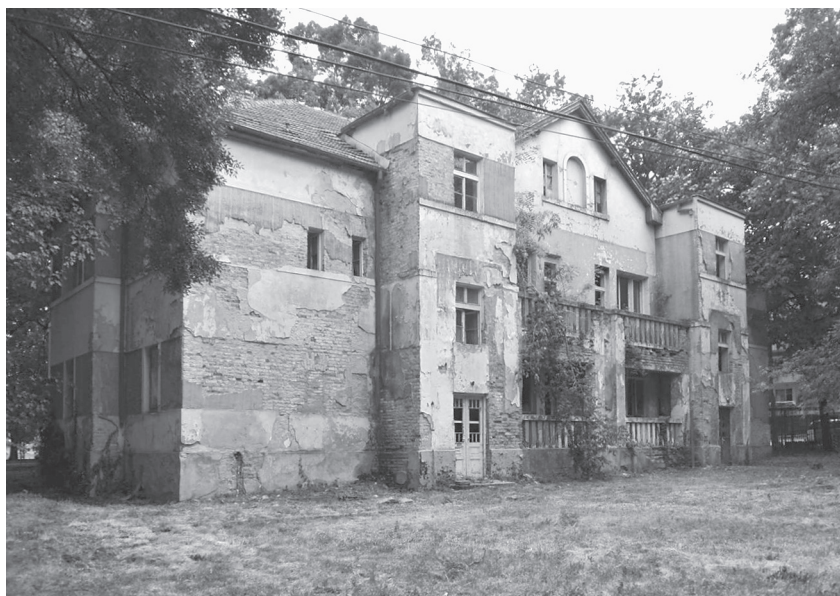
Úřednický dům – jeden z domů pro úředníky se dochoval do současnosti. Fotografie z roku 2016, autorka Lančová.

nám vyprávěli o prostorovém uspořádání kolonie, o minulosti a současnosti jejich domova. Dnes tyto objekty nejsou určeny pro zaměstnance, byty prošly privatizací, a tak v nich bydlí rozmanitá skupina lidí, kteří již nepracují v závodě.