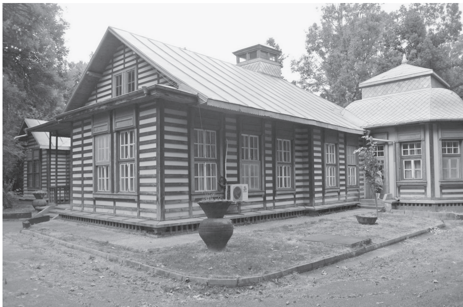
Vila Ing. Pícky – nalevo od hlavního vchodu, v zadní části parku, se dodnes dochovala vila dlouholetého ředitele cukrovaru Ing. Pícky. Fotografie z roku 2016, autorka Lančová.