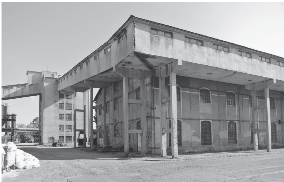
Fragment původní zástavby cukrovaru – zde je viditelná určitá část výrobní haly, která je však skryta pod pozdějšími dostavbami. Fotografie z roku 2016, autorka Lančová.

z 85 % zničeny. Pod troskami budov zahynulo 16 lidí (Bačvarov 2001: 65). Pro nové objekty cukrovaru byly následky přírodní katastrofy tragické. Většina instalovaného zařízení byla zasypaná. Podnik ihned začal řešit následky katastrofy a získal další finance od Pražské úvěrní banky.