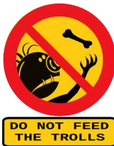
Obrázek 1. Nekrmte trolly!

Etymologicky trolling souvisí s trollem, postavou známou ze severské mytologie. Troll je potomek obrů či samotný obr (ale může to být i trpaslík), obvykle nižší inteligence, který se živí pojidáním lidí a kterému vůbec dělá radost lidem škodit. Fakt, že se bájní trollové živí lidmi, představuje zajímavou souvislost s internetovými trolly, kteří se jistým způsobem živí lidmi také, zejména jejich emocemi - odtud sebeobránné heslo: „Nekrmte trolly! (Do not feed the trolls)“.