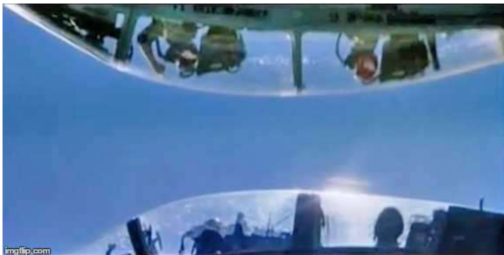
Obrázek 2. Trolling Migu

Slovo trolling se patrně objevuje během války ve Vietnamu v 60. letech, kdy američtí piloti prováděli tzv. trolling MiGů, tedy provokace nepřátelských pilotů podobné tomu, co předvádí ve filmu Top Gun Tom Cruise (Bishop, 2013).