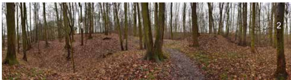
Obr. 3. Suchotlesky (k. ú. Ronov nad Doubravou). Panoramatický pohled od severu. Stav v roce 2017. 1 – vlastní tvrze; 2 – dvůr.

Abb. 2. Siedlungs- und Wirtschaftskomplex der mittelalterlichen Dorfwüstung und Feste Suchotlesky (Katastergebiet Ronov nad Doubravou). 1 – Feste; 2A–2C – Wälle; 3 – vorgezogenes Objekt der Feste; 4 – Wirtschaftshof mit eingetieftem zentralen Objekt; 5 – eingetieftes Wirtschaftsobjekt; 6 – Relikte einer Mühle; 7 – Mühlgraben; 8 – Wall; 9 – Wall/Damm des Wirtschaftshofes; 10 – Damm; 11 – Flurrelikte.