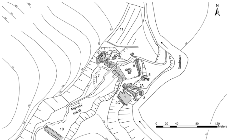
Obr. 2. Sídlištní a hospodářský komplex ZSV a tvrze Suchotlesky (k. ú. Ronov nad Doubravou). 1 – tvrze; 2A–2C – valy; 3 – předsunutý objekt tvrze; 4 – hospodářský dvůr se zahloubeným centrálním objektem; 5 – zahloubený hospodářský objekt; 6 – relikty mlýna; 7 – náhon; 8 – val; 9 – val/hráz hospodářského dvora; 10 – hráz; 11 – relikty plůžiny.

Abb. 2. Siedlungs- und Wirtschaftskomplex der mittelalterlichen Dorfwüstung und Feste Suchotlesky (Katastergebiet Ronov nad Doubravou). 1 – Feste; 2A–2C – Wälle; 3 – vorgezogenes Objekt der Feste; 4 – Wirtschaftshof mit eingetieftem zentralen Objekt; 5 – eingetieftes Wirtschaftsobjekt; 6 – Relikte einer Mühle; 7 – Mühlgraben; 8 – Wall; 9 – Wall/Damm des Wirtschaftshofes; 10 – Damm; 11 – Flurrelikte.