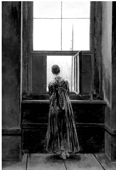
Caspar David Friedrich: Kobieta w oknie

Skonfrontujmy zatem wiersze Gippius i Cwietajewej o 'oknie', zwracając szczególną uwagę na specyfikę układów wertykalnych przestrzeni, w tym na problem stałości i zmienności. Pożyteczną „podpowiedzią” w tym zakresie może być krótka analiza obrazu Caspara Davida Friedricha Kobieta w oknie .