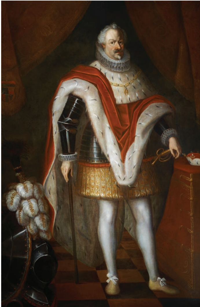
Abb. 5. Karl von Liechtenstein als Fürst und Ritter des Ordens vom Goldenen Vlies

(1599) hat ein gewisser Herr Karl von Liechtenstein, dem Feldsberg gehörte und der die Tochter Johann Šemberas zur Frau hatte, als erster vorangehend, aber auch mit seinen Ahnen die evangelische Religion um des weltlichen Ruhmes wegen fallengelassen und ist zum römischen Glauben übergetreten, wobei er seine Frau und seinen Bruder zu ebendieser Religion mitgeführt hat und nachfolgend eine nicht geringe Tyrannei um des Glaubens willen mit seinen Leuten und insbesondere seinen Untertanen führte, dabei nicht einmal dies der eigenen Mutter ersparte, so dass diese seine Mutter, die vor ihm wegen des Glaubens nicht in Ruhe leben konnte, vor ihm außer Landes floh, und aus diesen Gründen hat er bei den Jesuiten und dem Papst Liebe empfangen, die ihn dann um seiner Konversion zum Geheimen Rat dem römischen Kaiser Rudolf anvertraut haben. Nachfolgend blieb er in diesem Amt, wobei er dem Lande Mähren und seinem Geschlecht