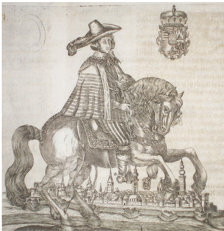
Abb. 3. Karl Eusebius von Liechtenstein als Fürst von Troppau

Der Verlauf des Ständeaufstands und auch jener der Konfiskationen nach der Schlacht am Weißen Berg reflektierte die staatsrechtliche und politische Situation in den Herzogtümern Troppau und Jägerndorf (Krnov) unter den spezifischen rechtlichen Bedingungen. 71 Die genannte Spezifik hing in erheblichem Umfang mit dem Bemühen der