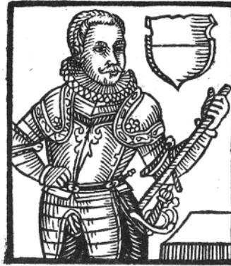
Abb. 1. Karl von Liechtenstein als junger protestantischer Adelige

Zeit findet sich darüber hinaus eine massenhafte Applizierung der Konfiskation vor allem nach der Niederlage der sog. ersten antihabsburgischen Rebellion im Jahre 1547. 20 Die Ständedirektorien, die selbst die Legalität der Staatsgewalt dedizierten, applizierten in Böhmen und auch in Mähren in den Jahren 1618 bis 1620 die Sanktion der Konfiskation, auch wenn sie sich (im Falle Böhmens) der Verletzung des Majestätsbriefes Rudolfs II. bewusst waren und mit diesem Akt in evidenter Weise den Rubikon eines möglichen künftigen Kompromisses mit Kaiser Matthias bzw. mit Ferdinand II. überschritten. Beide Direktorien bzw. beide Landtage stellten jene juristischen und physischen Personen, die es ablehnten sich ihrer Autorität zu unterwerfen, außerhalb des Gesetzes. 21