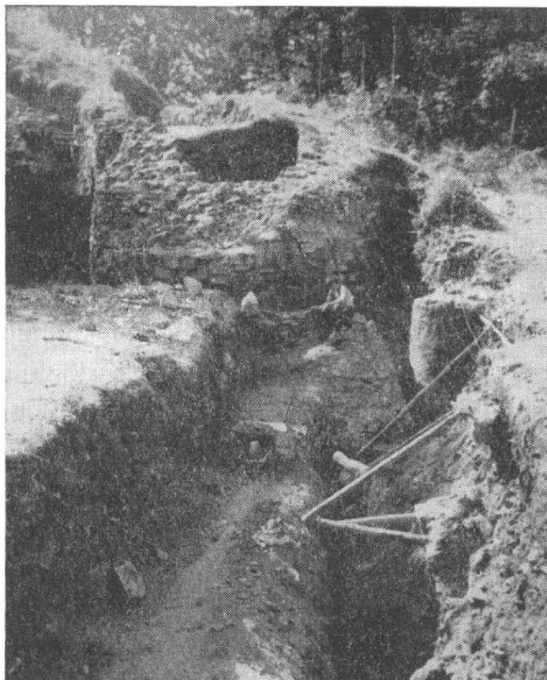
Obr. 3. Pohled na půlkruhovou věž, kryjící vstup do vlastního hradu – vpravo pilíř mostu.

talíře, mísy s malovaným dekorem, apod. Zajímavý byl nález keramiky falcké proveniencí a poměrně početně je také zastoupena habánská keramika. Soubor keramiky ze 14.–15. století lze charakterizovat poměrně dobře vypáleným materiálem. Převažující výzdoba na výduť je šroubovice, objevuje se i rastrování. V nepatrných zlomcích je doložena loštická keramika.