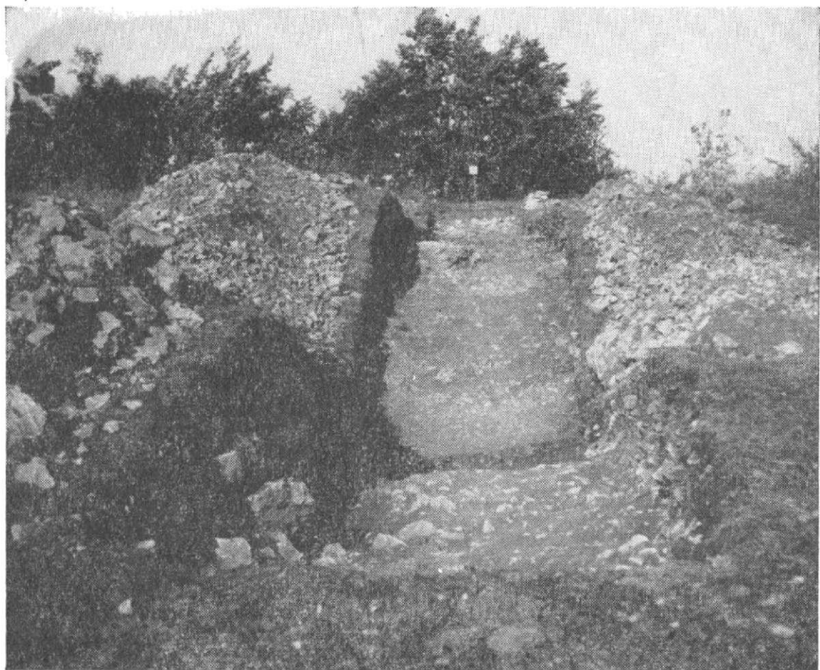
Obr. 2. Vyšehrad, okres Martin. Sonda cez valové opevnenie.

Archeologický materiál celé toto obdobie výrazne podporuje veľkým