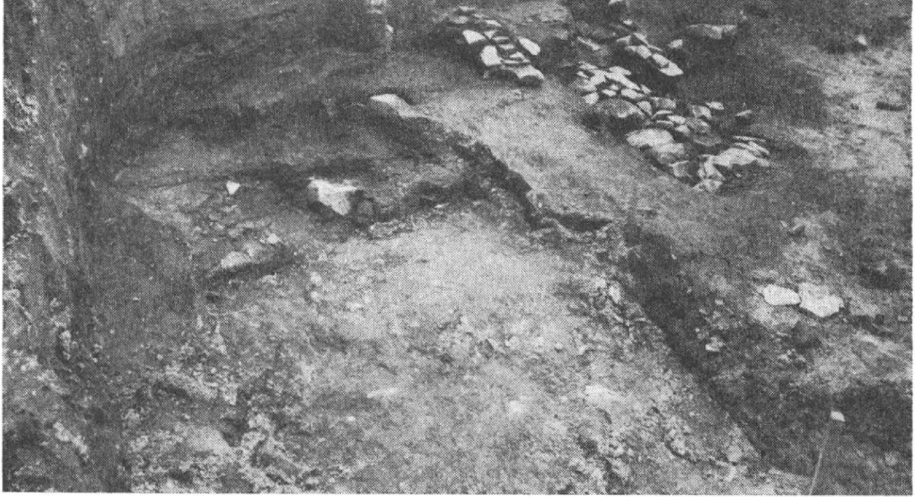
Obr. 2. Uh. Hradiště, Otakarova ul., obj. č. 9.

jak nás informují závěti obsažené v městské knize (např. L. n., fol. 3b).