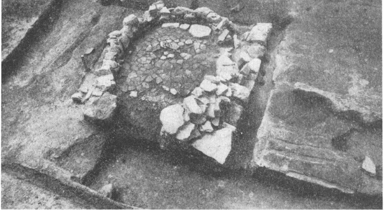
Obr. 1. Uh. Hradiště, Otakarova ul., obj. č. 10.

„Weichbildverfassung“. K definitivní ztrátě venkovského panství dochází však ve třicátých letech 14. stol., kdy se Kunovice stávají střediskem nevelké šlechtické domény (Verbík 1981, 102). Již v této době se nejbohatší měšťané zakupují v okolí, i když jediným sporným dokladem je vlastnictví Hluku Zdislavem Měščem doložené r. 1303 (CDM V, 149) 2 . Tato vrstva byla také zainteresována na výstavbě městského mlýna, k čemuž došlo k malé radosti cisterciáků před r. 1331 (CDM VI, 416). R. 1363 markrabí Jan odpouští měšťanům placení mýta v Čechách a na Moravě, uděluje mlóvé právo várečné a dva další výroční trhy (CDM IX, 322). Feudální vlastníci Starého Města a Kunovic se zde zřejmě pokoušeli obnovit a posílit některé výnosné živnosti, neboť r. 1378 privilegium markrabí Jošta znovu zakazuje krčmy a vaření piva v okruhu 1 míle a navíc i provozování řemesel. Obdobné zákazy obsahuje ještě privilegium krále Zikmunda z r. 1421 (Nisl 1920, 69, OAUH, i. č. 24).