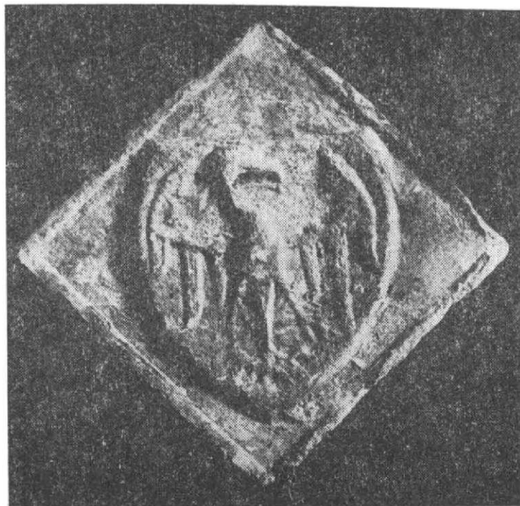
Obr. 2. Komorový (?) kachel s orlicí, NM Praha, 2. pol. 14. stol.

Nicméně to však ukazuje jen možnost takového datování a za současného stavu pramenné základny by bylo lépe položit počátky této varianty zatím obecněji do první třetiny 14. století. Zároveň to neznamena, že každý komorový kachel s malým formátem ČVS je nutně z počáteční vývojové fáze. Nové nálezy, které zatím přibyly, ukazují že tomu tak není. Dva kachle s malou ČVS se lvy ze studny v Praze 1 na Národní třídě podle E. Janské datovatelné do 2. pol. 14. století jsou toho dobrým příkladem (Janská 1977). Exemplář s orlicí z NM Praha (obr. 2) bezpečně ukazuje slohové vztahy k parléřovskému stylu a není tedy asi možný již v první pol. 14. století (Petráň 1970; Podlaha—Hilbert 1906; Chadraba 1971). Ještě lepší důkaz pro přežívání této varianty máme z Kartouzky v Olomouci, kde nejen velmi pravděpodobná doba zničení kamen k roku 1425, (Burlan 1966b), ale i až manýristická vysoce kvalitní modelace krásného stylu u orlice (Burlan 1966a), naznačuje dokonce dlouhou dobu používání této původně nejstarší české varianty komorového kachle. Svým formátem shodná s tyglíkovitými kachlí, které patrně provází, ztrácí smysl někdy