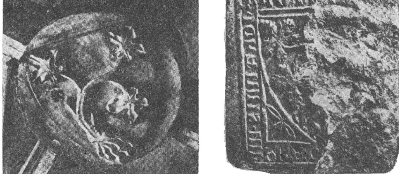
Obr. 6. Vlevo — Znak Jana IV. z Dražic (tři vlnné listy na kmeni), svorník klenby z augustiniánského kláštera v Roudnici n. L. — třetína 14. stol. Vpravo — Týž znak (poškozeno) na keramické desce z hradu Dražice a s nápisem uvádějícím Jana IV., doklad existence keramických desek v Janově okruhu (1. pol. 14. stol., před 1343).

mou, leč dosti těsnou souvislost mezi vynikající cisterckou stavební keramikou 2. pol. 13. století a technologií nejstarších kachlových reliefů (Schnyder 1958; 1972).