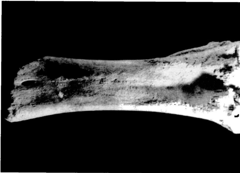
Obr. 2. prstní kost skotu s exostosami.