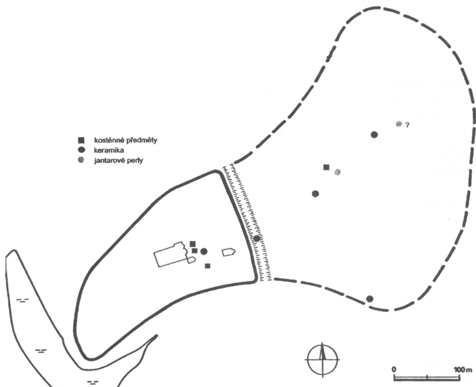
Obr. 2. Stará Boleslav. Rozmístění nálezů dokládajících kontakty s polským prostředím v ploše raně středověkého hradu.

Celkem byla zatím v prostoru raně přemyslovského hradu ve Staré Boleslavi identifikována necelá desítka předmětů různého typu (odhlížíme od jantarových perel, jejichž počet z r. 1910 není znám), u nichž lze s velkou pravděpodobností předpokládat původ v polském prostředí.