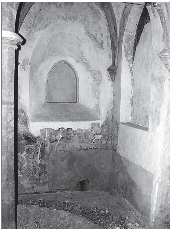
Obr. 11. Severný baldachýn v interiéri s odtlačkom menzy.

V Moste novým svetelným nárokom súbežne prispôbili nielen novovytvorené okná lode pod oltárnymi baldachýnmi, ale aj okno v južnom múre presbytéria, nahrádzajúce skorší