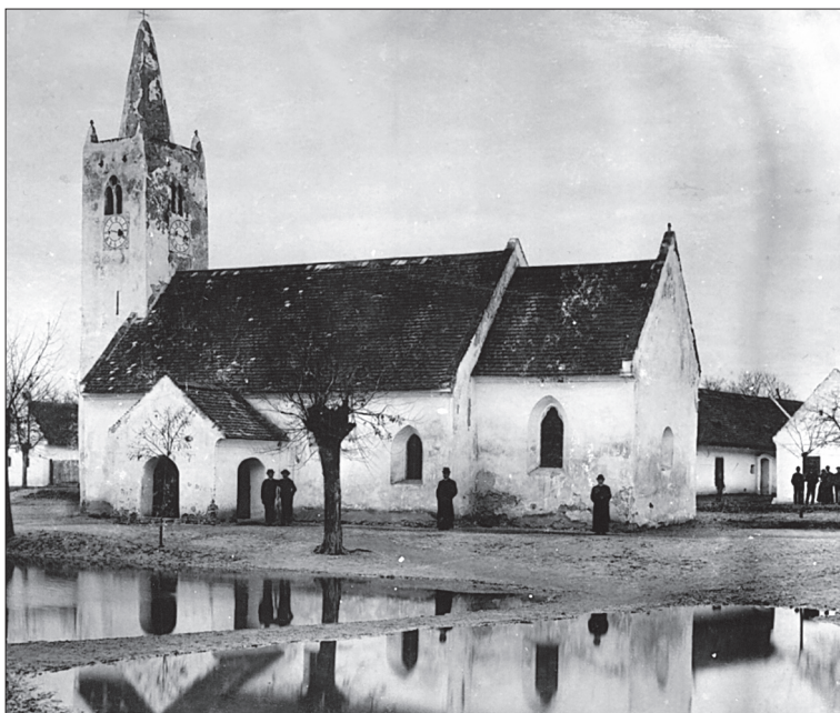
Obr. 3. Južná fasáda kostola pred rozšírením, okolo 1909, archív KÖH, Budapešť, Fotótár, inv. č. 18051.

Zo stavebných detailov, patriacich k fáze vzniku kostola, sa v kompletnom stave nezachoval žiadny, niekoľko okenných otvorov poznáme aspoň vo fragmentoch. Patrí k nim štrbinové okno vo východnom múre presbytéria, z ktorého na fasáde sa odkryla spodná časť zošíkmej špalety s rovným parapetom. Ukazuje sa, že okno nebolo situované presne na stred východnej fasády, ale jeho os bola mierne (cca o 40 cm) posunutá doprava. Ďalšie prvky východného okna sa už nezachovali. Iba podľa archívnej fotografickej dokumentácie,