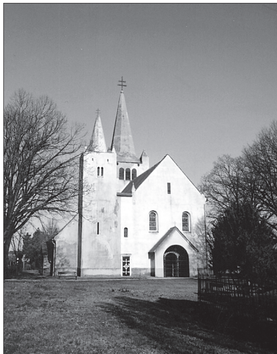
Obr. 1. Kostol v Moste pri Bratislave, súčasný stav fasády.