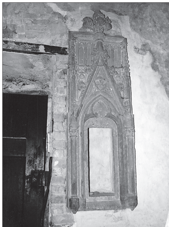
Obr. 10. Pastofórium v presbytériu.

Abb. 9. Nordwand des Kirchenschiffs, Fund eines rautenförmigen Fensters.