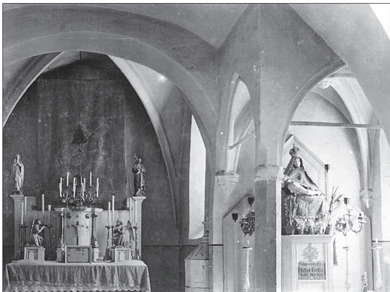
Obr. 7. Interiér kostola s južným baldachýnom, po 1910, archív KÖH, Budapešť, Fotótár, inv. č. 25345.