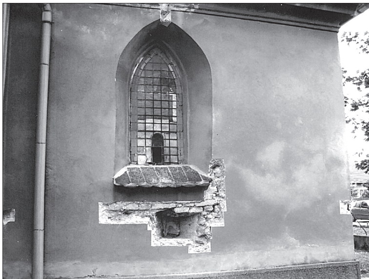
Obr. 5. Východná stena presbytéria, nález okna.