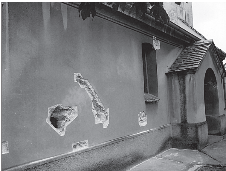
Obr. 9. Severná stena lode, nález kosoštvrcového okna.

Abb. 9. Nordwand des Kirchenschiffs, Fund eines rautenförmigen Fensters.