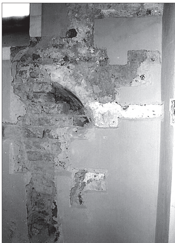
Obr. 6. Severná stena lode, nález odtlačkov tribúny a okna pod emporou. Abb. 6. Nordwand des Kirchenschiffs, Fund von Abdrücken der Empore mit Rundfenster.