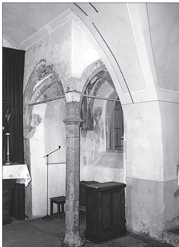
Obr. 8. Južný baldachýn, súčasný stav.