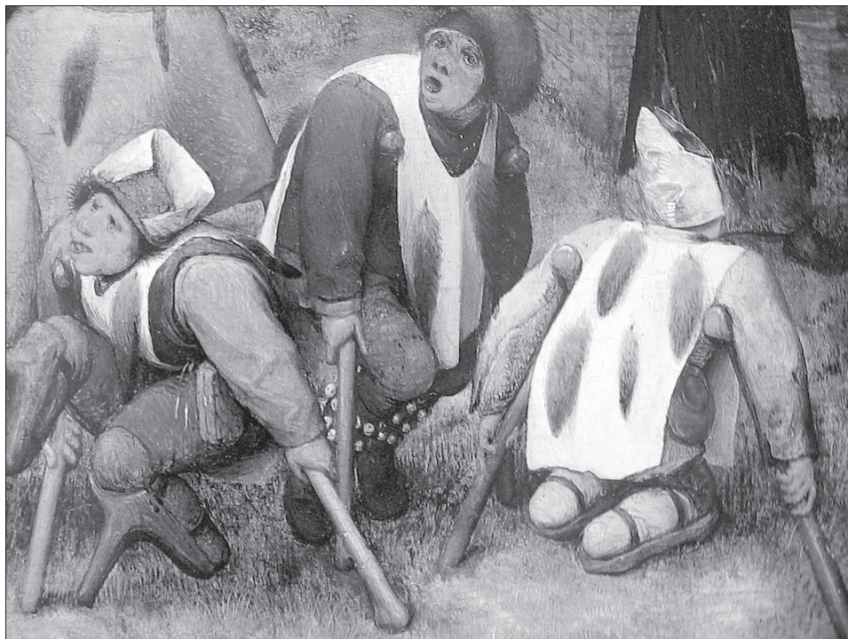
Obr. 1. Detail obrazu Pietera Breughla z roku 1568, nazvaného „Mrzáci“. Louvre, Paříž.