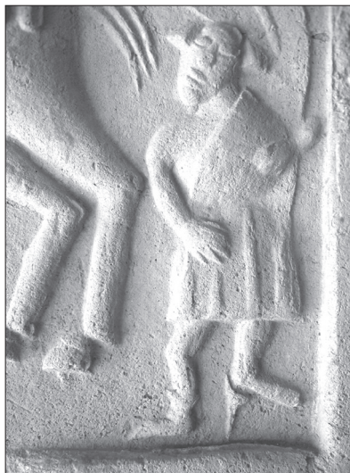
Obr. 4. Vlevo – Sv. Martin a postižený žebřák – dělení pláště. Kachlový reliéf, druhá polovina 15. století, Hradec Králové, město. Vpravo – detail postavy žebřáka s amputovanou nohou podepřenou klečkou.