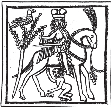
Obr. 7. Sv. Martin a postižený žebřák – dělení pláště. Kachelový reliéf, konec 15. století, Jawor, hrad a zámek (Slezsko).

chudáky s pokrčenou nohou amputovanou v oblasti kotníku, ke které je upevněna kolenní klečka (obr. 4 a 5). Postižení žebřák na dalším obrázku je těžší, protože pahýl levé nohy nemůže v kolenu ohnout. Tvůrce reliéfu motiv berle nebo jiného podpůrného prostředku do své kompozice nezahrnul, a noha tak trčí bez opory v prostoru (obr. 6). Na poslední svatomartinské scéně má žebřák amputovaná obě chodidla. Protože se pravděpodobně nemůže vztyčit ani pomocí berlí, je nucen se pohybovat pouze v pokleku. K tomu mu pomáhají nízké opěrné trojnožky (obr. 7). Kachel pochází z území někdejšího rozlehlého Slezska dlouhodobě tvořícího součást zemí Koruny české (dnes se místo jeho nálezu – zámek Jawor – nalézá na území Polska).