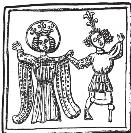
Obr. 8. Sv. Alžběta Durynská s postiženým. Kachlový reliéf, konec 15. století, Třešť, město.