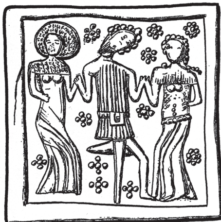
Obr. 10. Sv. Alžběta Durynská s pomocnicí a postiženým. Kachlový reliéf, kolem 1500, Landštejn, hrad.