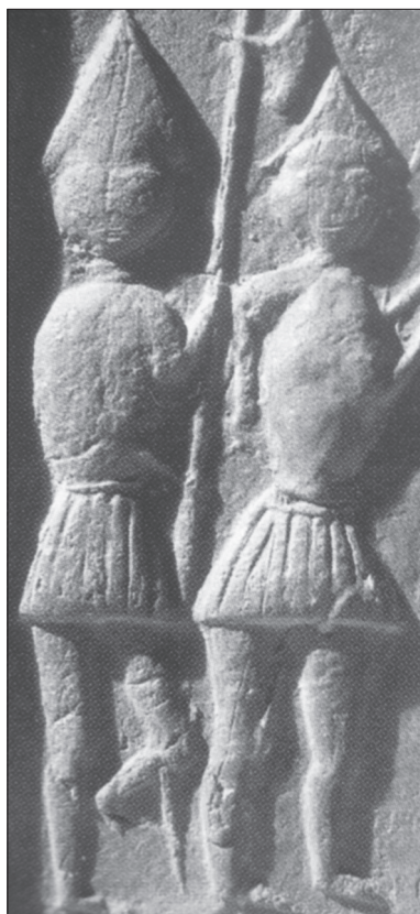
Obr. 11a. Husitská bojová pěchota s postiženým halapartníkem, detail. Kachlový reliéf, před polovinou 15. století, Lichnice, hrad.