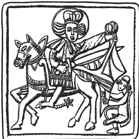
Obr. 5. Sv. Martin a postižený žebřák – dělení pláště. Kachlový reliéf, druhá polovina 15. století, Praha, Staré Město.