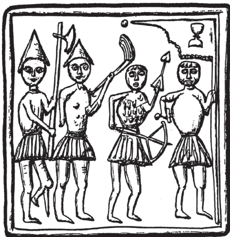
Obr. 11. Husitská bojová pěchota s postiženým halapartníkem. Kachlový reliéf, před polovinou 15. století, Lichnice, hrad.

Dosud popisovaný výskyt figury invalidy s protézou dobře zapadá do ikonografických souvislostí. Ve scénách s uvedenými světcí jsou logicky přítomni chudí a nemocní hledající pomoc a útěchu. Úplně jiné souvislosti však musíme hledat, když se objeví invalida s protézou mezi husitskou pěchotou (obr. 11, 11a). Tento reliéf byl již několikrát zpracován a publikován (Brych 2004, 124, kat. č. 274; Hazlbauer 1998, 203–204, obr. 119; Kočí–Vondruška 1989, 91, kat. č. 274; Kouba 1966, 27, obr. 2) a po ikonografické stránce byl na něm rozpoznán mj. unikátní výskyt střelné zbraně zvané píšťala s neobvyklým žánrovým detailem – s dýmem stoupajícím po výstřelu z hlavně. Znázornění protézy však dosud pozornost věnována nebyla. Tento detail patrně unikal proto, že protéza se může jevit jako pokračování ratiště halapartny. Reliéf je dost primitivní a při známé naivitě některých gotických prací mnoho neznamená, když na sebe uvažované části halapartny nenavazují. Pravá noha posledního pěšáka je ale pokrčená charakteristickým způsobem pro středověké invalidy, a navíc je od kolena dolů zakrnělá. Porovnáme-li nohy všech znázorněných postav je tato anomálie zcela