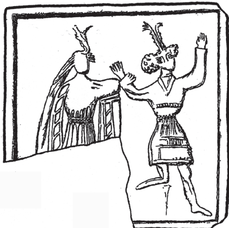
Obr. 9. Sv. Alžběta Durynská (?) s postiženým. Kachlový reliéf, konec 15. století, Praha, Staré a Nové Město (kresebná rekonstrukce).