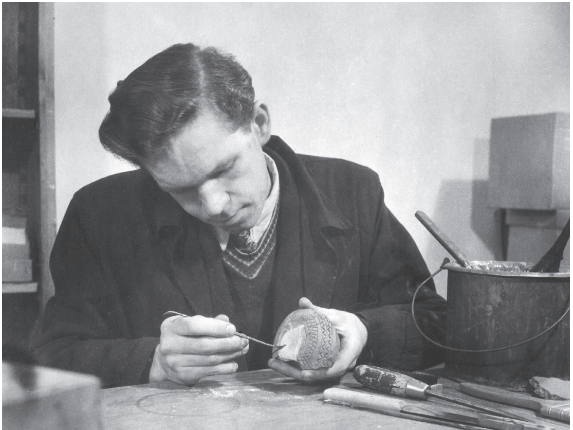
V. Podborský při laboratorním zpracování pravěké keramiky, pravděpodobně přelom 50. a 60. let 20. století

u Těšetic-Kyjovic na Znojemsku, kterou vedl v letech 1967–1985. V této době se zde podařilo identifikovat do té doby neznámý fenomén z oblasti religiozity neolitického člověka, tzv. rondelovou architekturu. Její výzkum, který je dnes ve středoevropském kontextu jedním z klíčových témat archeologie mladší doby kamenné, zahájil a odborně významně rozvinul. Vedle odborného zaměření na obecné otázky pravěku střední Evropy věnuje systematickou pozornost metodologii studia pravěku, archeoreligionistice i samotným dějinám oboru. Ve všech zmíněných oblastech publikoval nepřekonané monografie a studie, které vytvářejí jednoznačný základ moderního prehistorického výzkumu našich zemí. Pro všechny archeology je základním textem syntéza Pravěké dějiny Moravy (Brno 1993), jejímž je Podborský spoluautorem a editorem a za niž také obdržel Cenu Josefa Hlávky. Pro studenty archeologie nejen na Masarykově univerzitě jsou pak zcela nezbytnou učebnicí Podborského Dějiny pravěku a rané doby dějinné , které vyšly již v několika vydáních.