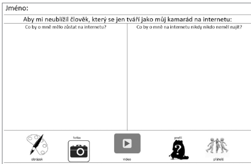
Obrázek 8 Časová kapsle