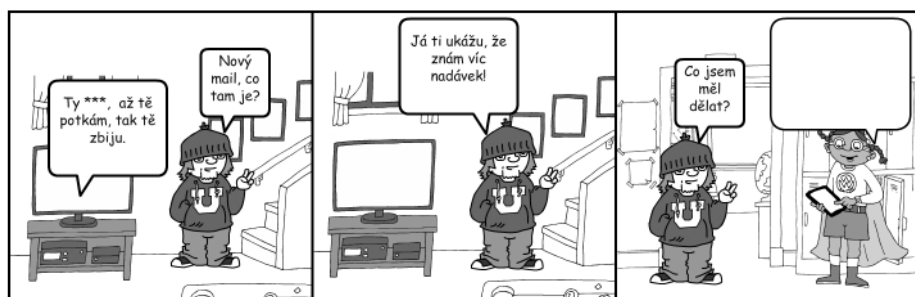
Obrázek 6 Komiks pro reflexi desatera bezpečného internetu