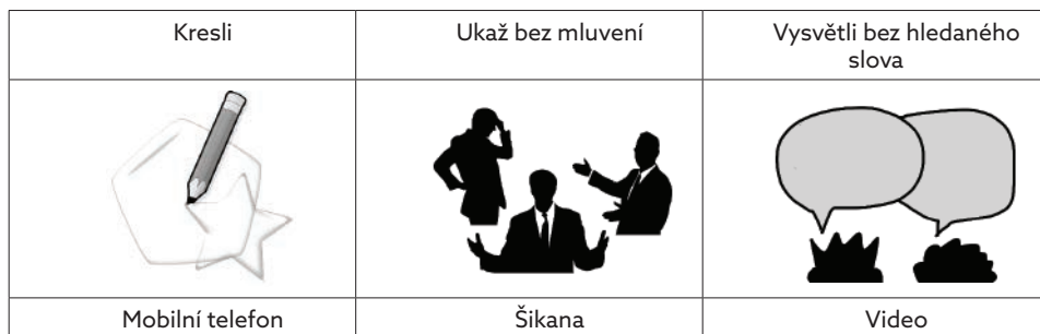
Obrázek 12 Zadání pro rychlé špióny