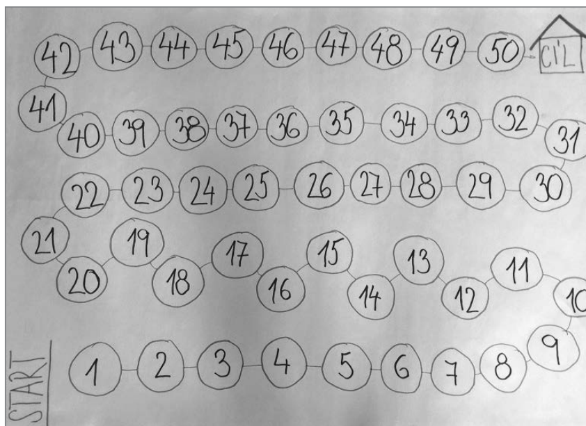
Obrázek 5 Herní plán Člověče, nezlob se