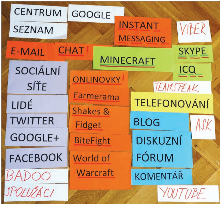
Obrázek 9 Připravené názvy komunikačních služeb