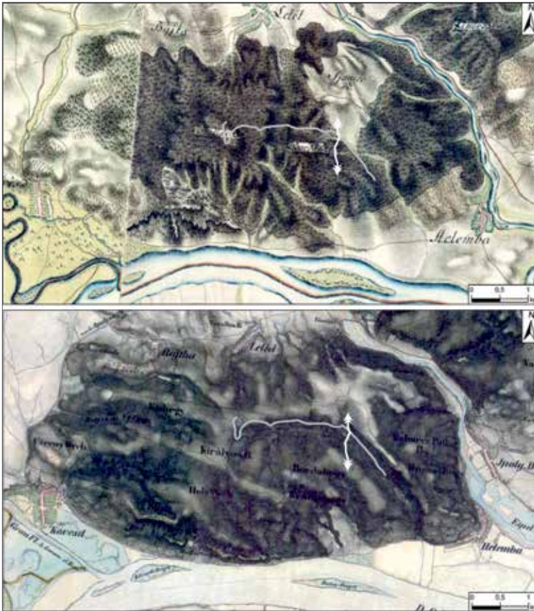
Obr. 5. Pohorie Burda na prvom (hore) a druhom (dole) vojenskom mapovaní. V severovýchodnej časti pohoria viditeľná výrazná odlesnená enkláva na prvom vojenskom mapovaní s pomenovaním Sjaniec B. (Šancový vrch). Biela línia – situovanie zemného valu, šedá línia – lesná cesta Dona potok. Zdroj https://www.arcanum.hu/hu/mapire/ ; doplnila N. Beljak Pažinová.

Abb. 5. Burda-Gebirge auf der ersten (oben) und zweiten (unten) militärischen Kartierung. Auf der ersten militärischen Kartierung ist im nordöstlichen Teil des Gebirges eine deutliche abgeholzte Enklave mit der Bezeichnung Sjaniec B. (Schanzenhügel) zu erkennen. Weiße Linie – Lage des Erdwalls, graue Linie – Waldweg Dona potok. Quelle https://www.arcanum.hu/hu/mapire/ ; ergänzt von N. Beljak Pažinová.