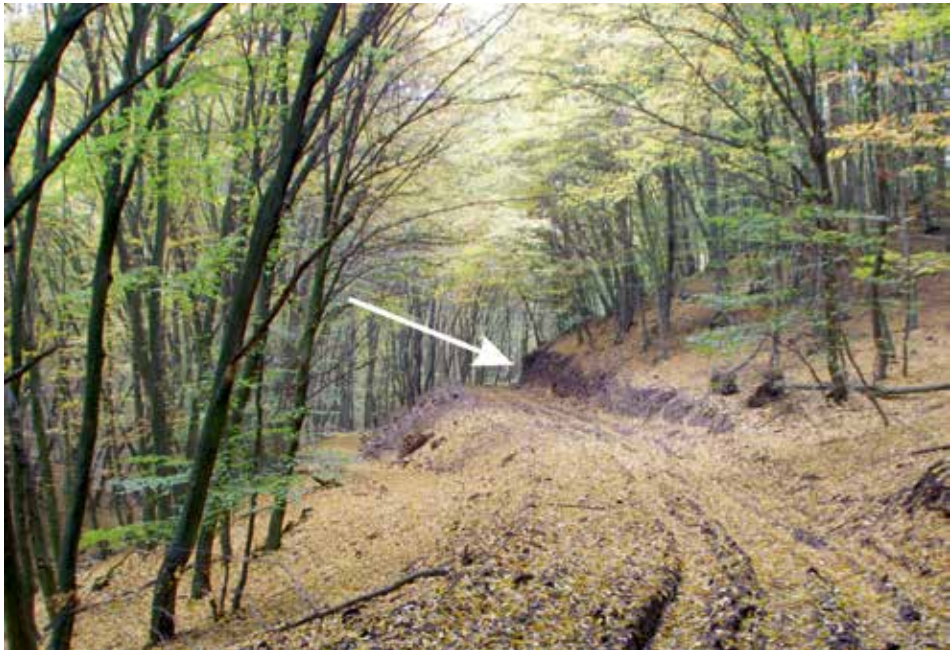
Obr. 2. Miesto križovania lesnej cesty Dona potok a zemného valu v pohorí Burda na jeseň 2012. Foto N. Beljak Pažinová. Abb. 2. Stelle, an welcher sich im Herbst 2012 der Waldweg Dona potok und der Erdwall im Burda-Gebirge kreuzten. Foto N. Beljak Pažinová.

Zemné práce na rekonštrukcii cesty boli sledované od októbra 2012 do júla 2013. Počas jesenných zemných prác sa v katastri obce Chľaba podarilo identifikovať zemný val, ktorý bol archeologicky skúmaný na jar. Objavil sa v km 2,75 pri rozširovaní cesty zarezaním do svahov a v miestach s prudším svahom nad cestou zosvahovaním do miernejších sklonov. Val, ktorý pôvodná cesta prerezala už v minulosti, bol zdokumentovaný v reze v mieste, kde ho lesná cesta „Dona potok“ križovala (obr. 2).