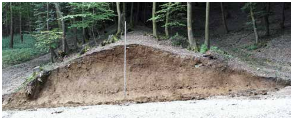
Obr. 3. Pohorie Burda, lesná cesta Dona potok. Zemný val. Fotodokumentácia južného profilu na jar 2013.

Priebeh valu sa podarilo v teréne zmerať celkovo v dĺžke okolo 1 km (obr. 1). Val je v pohorí Burda orientovaný v smere sever–juh a smeruje od časti Burdov, kde najvyšší bod valu dosahuje výšku takmer 300 m n. m. (ďalej južným smerom k obci Chľaba je viditeľný dlhší strmý