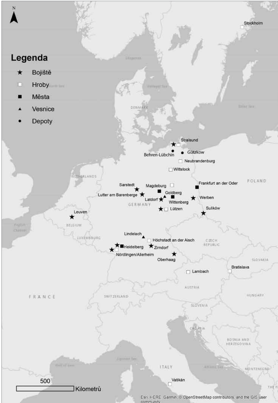
Mapa 1. Mapa zahraničních lokalit z doby třicetileté války. © M. Preusz. Karte 1. Karte ausländischer Fundstellen aus der Zeit des Dreißigjährigen Krieges. © M. Preusz.