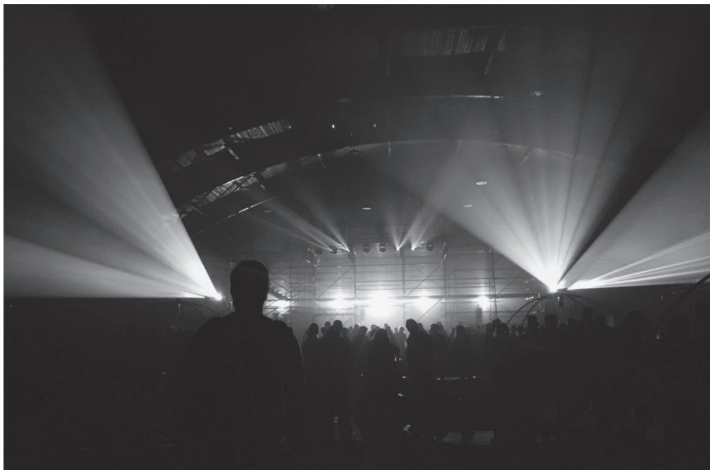
Obr. 4: