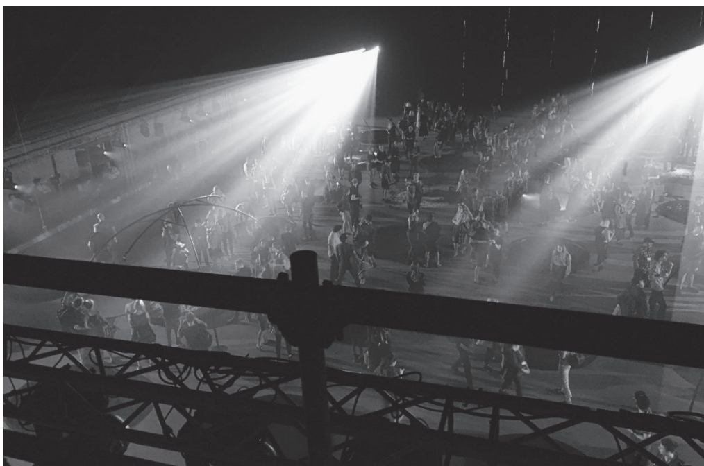
Obr. 5: Foto archiv autorky