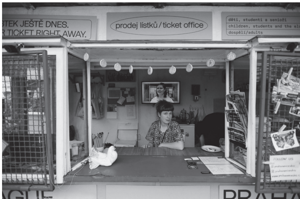
Obr. 7:

akce, bez něhož by zvolené prostředí nedisponovalo kýženými významy.