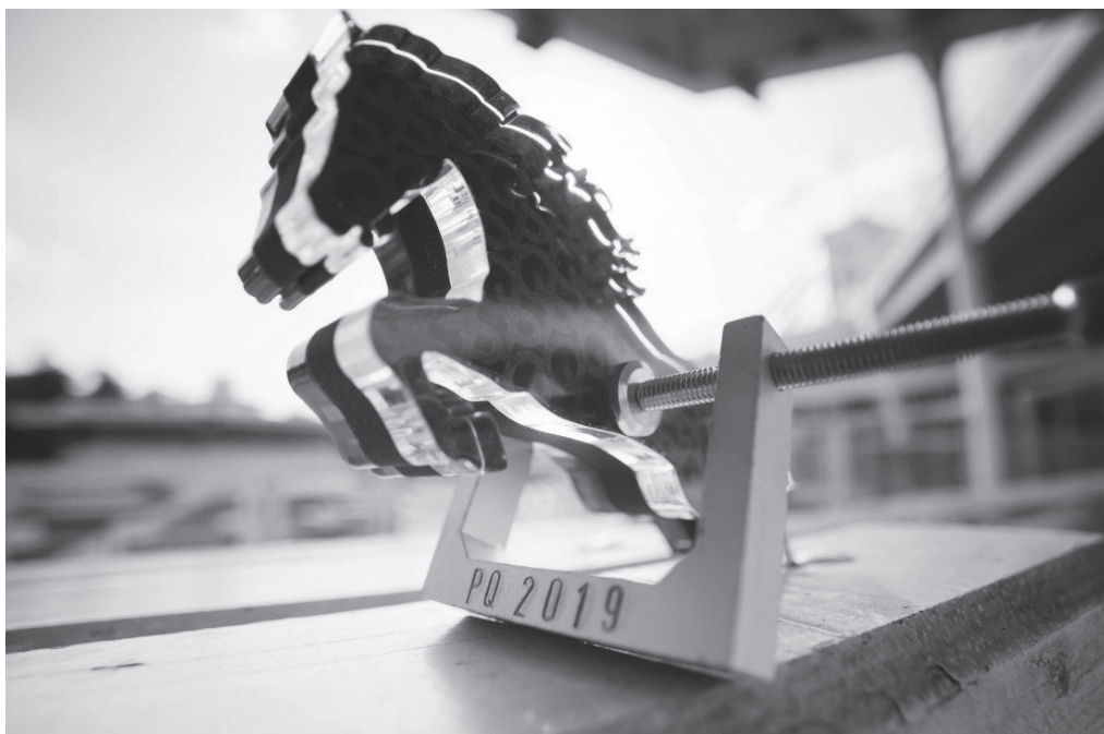
Obr. 6: Cenu navrhl Petr Bakoš.

jako je například právě Zlatá triga či Cena za nejlepší expozici, udělila porota také zcela nové ceny, jako Ocenění za nejvýraznější talent nebo Ocenění za Imaginaci: „Dali jsme porotě možnost, aby utvořili nějaké ceny sami, právě podle toho, co vidí jako nově se vyvíjející část scénografie [...]. Inovace nás určitě zajímá a ze všeho nejvíc nás zajímá týmová spolupráce a spolupráce vůbec.“ 8