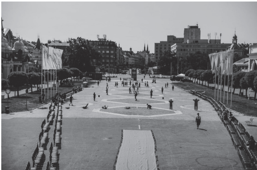
Obr. 1: Foto Saša Dobrovodský

jako pomyslný rámec celého uvažování o dějišti PQ . Jinými slovy geometrizace areálu, potažmo celého vizuálního stylu letošního PQ , určovala i jeho obsahovou náplň.