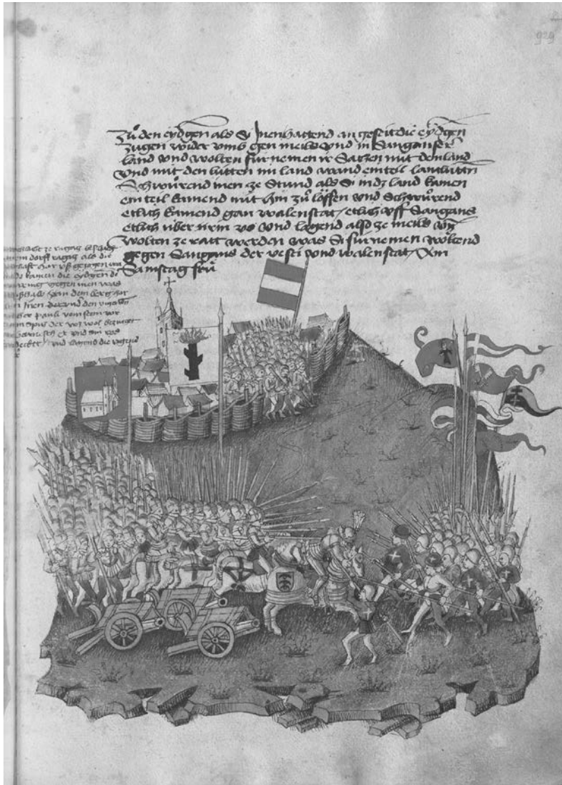
Abb. Die Schlacht bei Ragaz 1446 in der Chronik des Bendicht Tschachtlan (1470) (Zentralbibliothek Zürich, Ms A 120, S. 929).

Disen tag hend gmeine landtlüth uffgenommen wie eins helgen apostlentag zfiren von wegen einer grossen schlacht, so im jar 1446 zuo Ratatz gschach. Man soll och uff gemelten tag jarzit halten aller deren, so ynn unserer landtlüten dienst und kriegen sind umkon. 28 Wie der Text in die