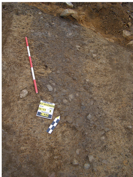
Obr. 6. Fotodokumentace štětované plochy.

Zánik obou popisovaných sakrálních staveb lze zřejmě dát do souvislosti s odchodem obyvatel osad situovaných u těchto kostelů do nově založeného královského města Plzeň na konci 13. století. K osudu svatyní se vyjadřuje pouze Bonaventura Piter, podle kterého byl kostel sv. Martina zničen pobořením a požáry, z kostela sv. Václava se údajně nedochovaly ani sutiny (Šváb ed. 1988, 54, 86).