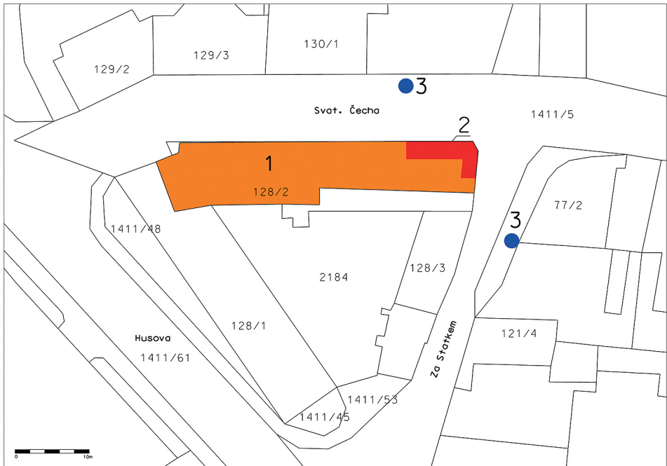
Obr. 2. 1 – vyznačení rozsahu plošného odkryvu; 2 – zkoumaný pohřební areál; 3 – starší nálezy hrobů (podle Široký–Nováček–Kaiser 2004, 808, obr. 6). Orientováno k severu. Autor V. Dudková.