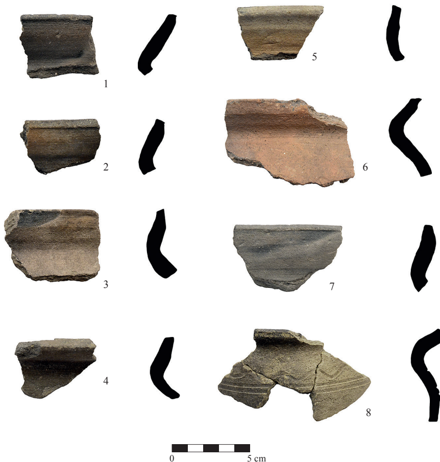
Tab. 1. Výběr typických keramických zlomků: 1, 2 – sonda 1B, k. 101; 3–5 – sonda 1B, k. 502; 6, 7 – sonda 1B, k. 503; 8 – k. 101. Autor I. Šlechtová.