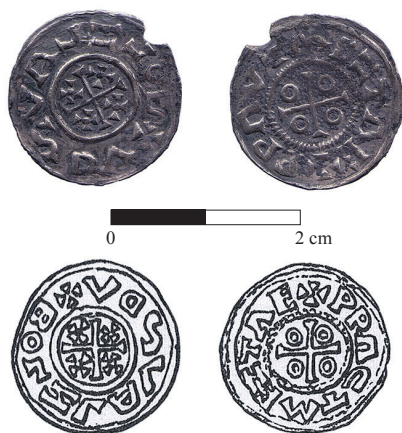
Obr. 5. Nalezený denár Boleslava III. Kresba denáru typu C 205. Podle Cach 1970, č. 205.