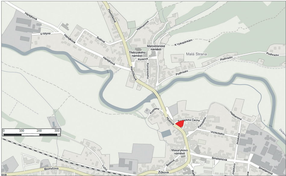
Obr. 1. Lokalizace plochy výzkumu v plánu Starého Plzně. Autor V. Dudková.