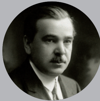
Inocenc Arnošt Bláha