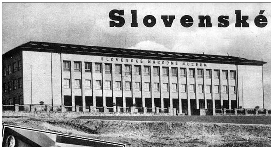
Obr. 2. Budova Slovenského národného múzea v Turčianskom Sv. Martine. V nej mal svoje sídlo aj Štátny archeologický ústav.