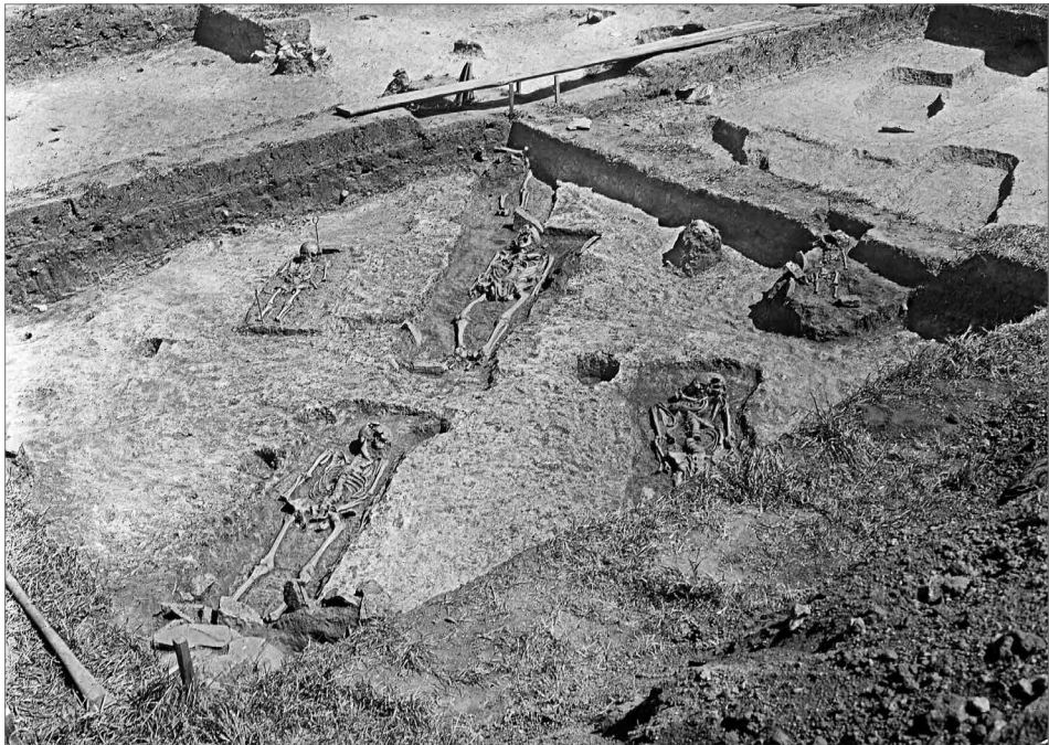
Obr. 5. Kostrové pohřebiště ve vnitřním areálu, sektor B1. Abb. 5. Skelettgräberfeld im Innern des Areals, Sektor B1.