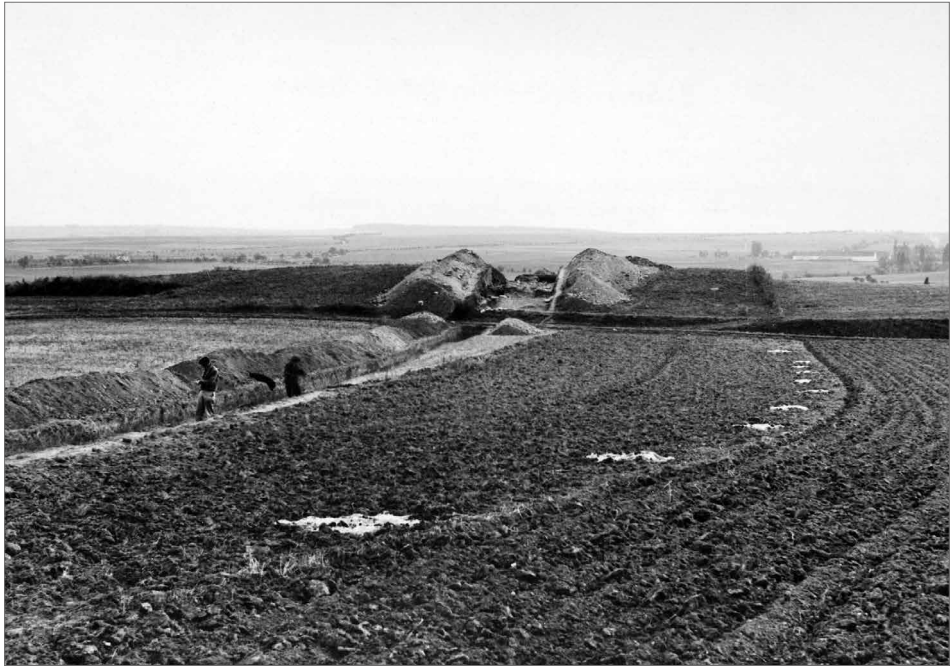
Obr. 2. Dlouhá sonda 1/1948 a řez destrukcí vnitřní hradby od severu.