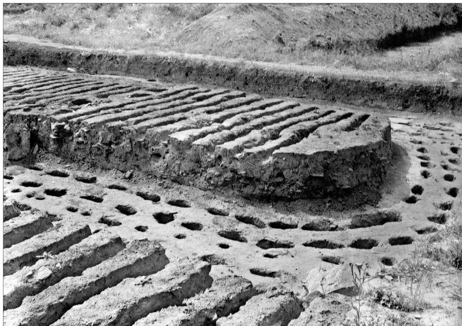
Obr. 3. Pozůstatky roštové výztuže mladší hradby nad západním závěrem tzv. halové stavby.

Abb. 3. Überreste der Rostversteifungen der jüngeren Wehrmauer über dem Westende des sog. Hallenbaus. Foto Autor unbekannt, 1952. Quelle Archiv des Archäologischen Instituts der Akad. d. Wissenschaften der Tschechischen Republik Prag, C-FT000008381.