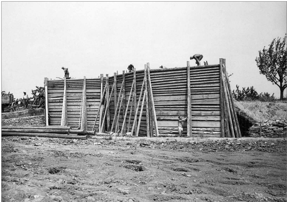
Obr. 4. Rekonstrukce vnější brány v roce 1952, západní křídlo. Abb. 4. Rekonstruktion des Außentors im Jahr 1952, Westflügel.