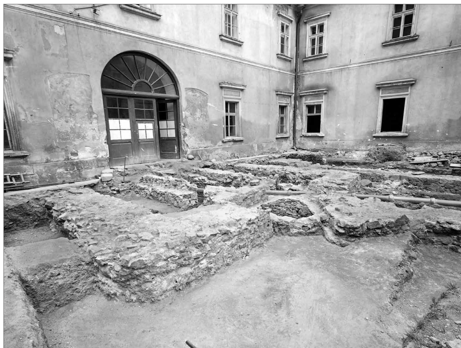
Obr. 9. Výzkum rajského dvora.