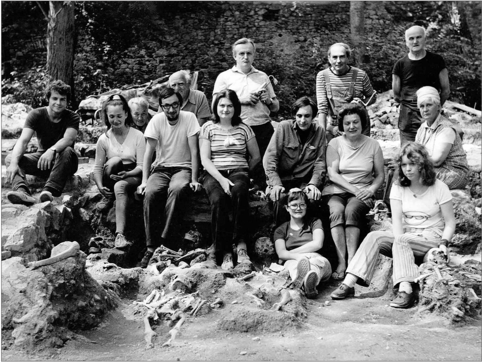
Obr. 10. Skupinová fotografie účastníků výzkumu v severní zahradě v roce 1974.