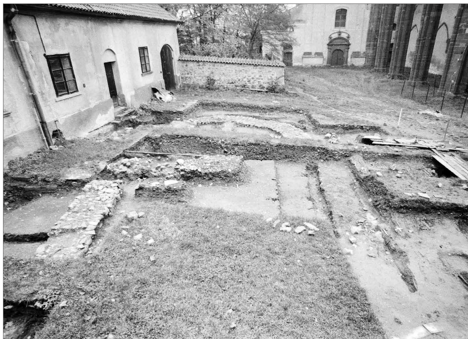
Obr. 11. Výzkum církevní stavby na prvním nádvoří před konírny.

Abb. 11. Grabung am Kirchenbau im ersten Hof vor den Pferdeställen.