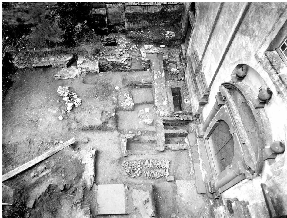
Obr. 1. Celkový pohled na výzkum před západním průčelím kostela, 1940.

hrobek a tři náhrobky. Na jižní straně portálu ležela náhrobní deska z opuky opálená do červena, která byla narušena zdí chrámu. U jejího západního konce byl nalezen pražský groš z doby Vladislava II. Západně a o 60 cm hlouběji ležela další deska z červeného pískovce. Ještě dále na západ se nacházela poslední, rozpadlá gotická náhrobní deska z vápence s nečitelným nápisem. Severně od vstupu do kostela, podél průčelí se nacházela původně klenutá, nyní propadlá hrobka posledního opata Leandra Kramáře († 1801). Na soklu starší zdi před touto hrobkou byl objeven obrázek světce tepaný v silně pozlaceném bronzovém plechu, pravděpodobně středověké knižní kování v druhotné poloze. V interiéru kostela výzkum doplnila sonda situovaná východně u vstupu do kapele Panny Marie, kde byly zjištěny tři podlahy různého stáří a jeden pohřeb. V přílehlé barokní kryptě byly objeveny pohřby mnichů ze 17. století.