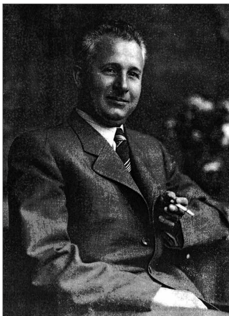
Obr. 2. Ivan Borkovský (1897–1976).