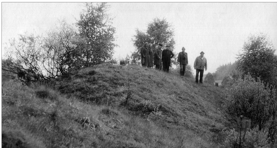
Obr. 7. Karel Škrábek při práci komise státní památkové péče na lokalitě Čmelíny-Sejpy (okr. Plzeň-jih).