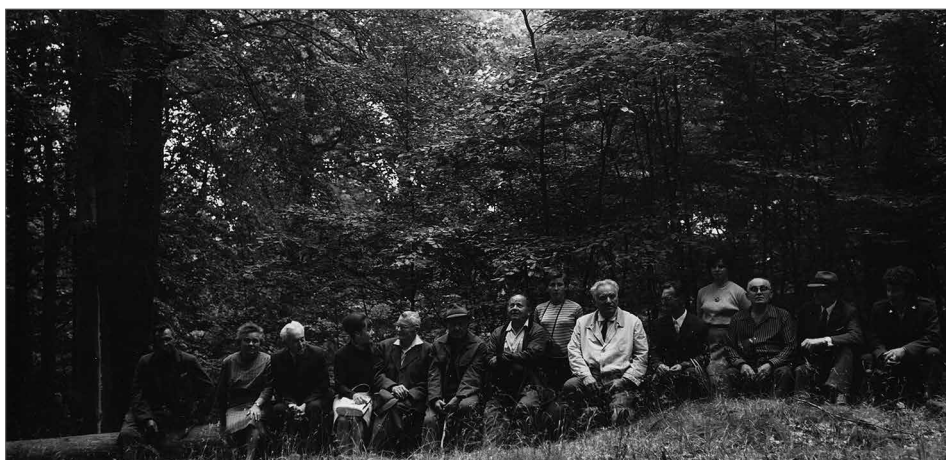
Obr. 8. Komise (aktiv) státní památkové péče Okresního národního výboru Plzeň-jih na Chýlavě u Blovic v roce 1976. Zdroj Archiv Muzea jižního Plzeňska v Blovicích.

uměleckoprůmyslové, historické a literárněhistorické. Základem tehdejší archeologické sbírky byly soubory z eneolitických výšinných sídlišť jižního Plzeňska, významnou součástí se však staly nálezy z období středověku a raného novověku, namátkou nálezy z cisterciáckého kláštera v Pomuku, z Obrova hradiště u Žinkov nebo ze slovanského hradiště Hůrka ve Starém Plzenci.