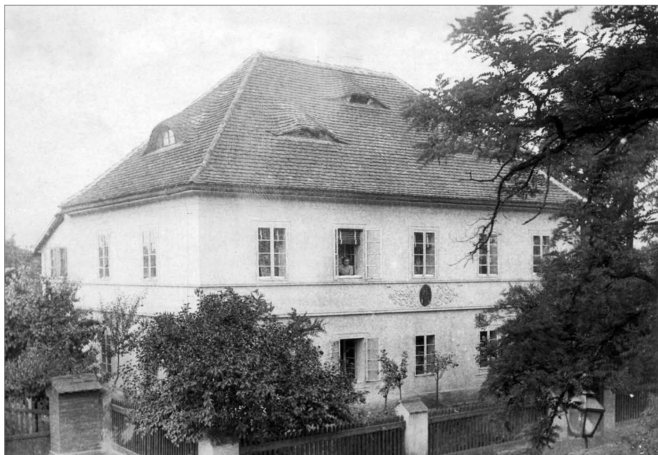
Obr. 4. Blovice, Raušarův dům čp. 148, do roku 2000 sídlo Okresního muzea Plzeň-jih.

poštovní úředník a výrazná osobnost památkové péče na Plzeňsku (Hudecová 2019, 13).