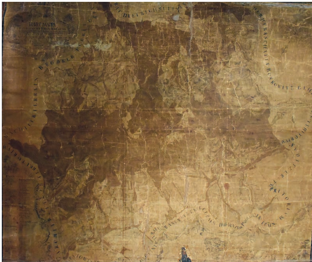
Obr. 1: Mapa panství Šebetov 1759 (MZA, F 91 Velkostatek Šebetov, mapa č. 129)