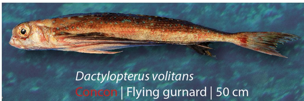
Figura 1: Peixe concon. Fonte: STP (2007) e Rodrigues et. al 2020.