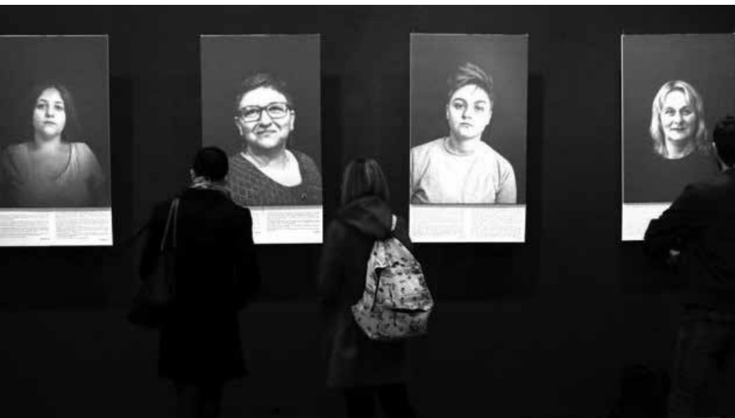
Obr. Výstava o dětech války

Z toho potom dále mohou vyústit snahy o větší informovanost společnosti a o plošnou