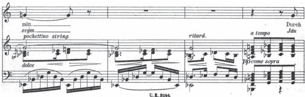
Abb. 6 Novák, Takt Nr. 11-15, Ende der ersten Strophe.