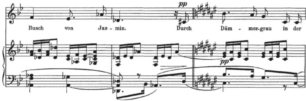
Abb. 5 Strauss, Takt Nr. 13-15, Ende der ersten Strophe.

Demgegenüber steigt bei Novák die Melodieführung zum g^1 zu einem offenen Ende der ersten Strophe, die Zäsur zwischen der ersten und zweiten Strophe realisiert sich somit nicht in der melodischen Horizontale, sondern in der Begleitung im kurzen Zwischenspiel, in dem die rhythmische sowie harmonische Satzung moduliert werden.