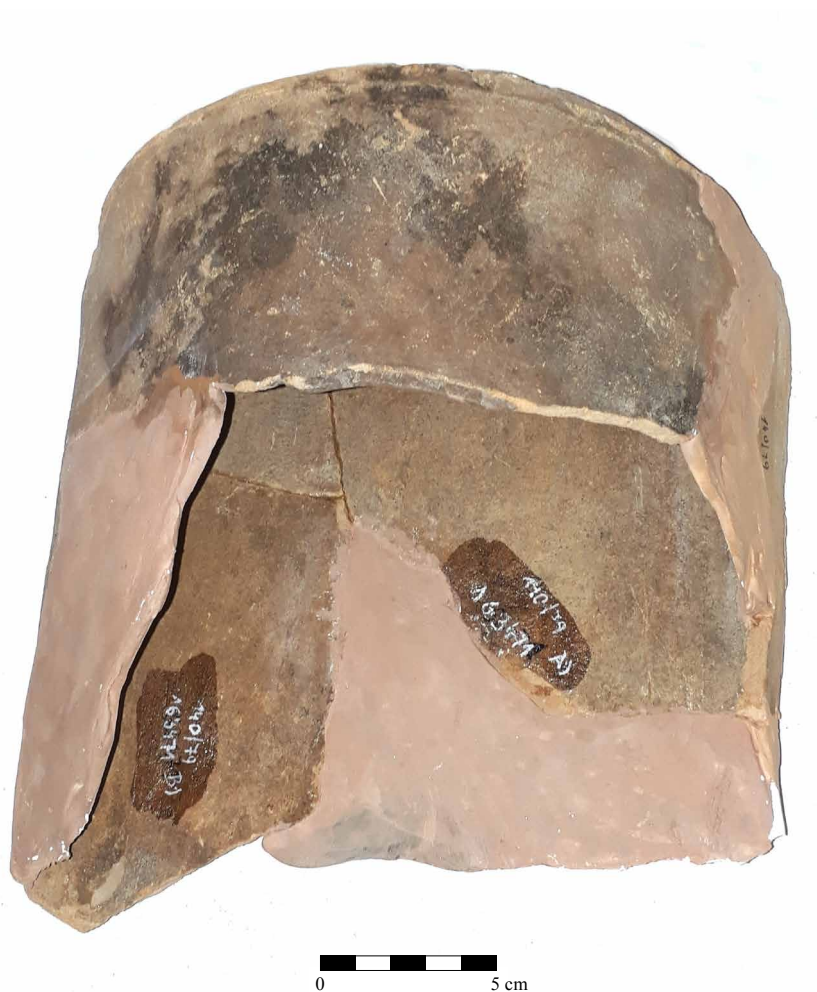
Obr. 7. Torzo půlválcové komory kachle s motivem mitry, berly a nápisové pásky, inv. č. A 63471, z objektu 2.