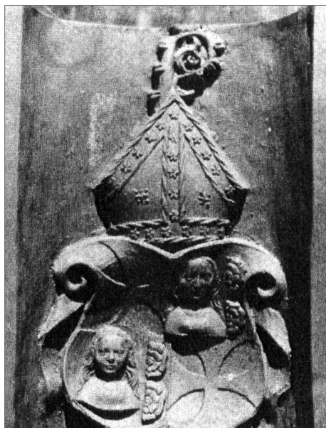
Obr. 10. Heraldický motiv s biskupským znakem lübeckého biskupa Grimmolta (1510–1523) z muzea v Lübecku. Podle Strauss 1972, II. Teil, 132, Tafel 78, Nr. 3.

Abb. 10. Heraldisches Motiv mit Bischofsensemble des Lübecker Bischofs Grimmolt (1510–1523) aus einem Museum in Lübeck. Nach Strauss 1972, II. Teil, 132, Tafel 78, Nr. 3.