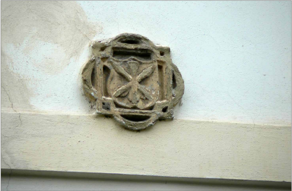
Obr. 8. Znak Jana Filipece ve vnějším východním zdivu františkánského kláštera v Uherském Hradišti. Foto D. Menoušková. Abb. 8. Emblem von Johann Filipec an der östlichen Außenwand des Franziskanerklosters in Uherské Hradiště. Foto D. Menoušková.