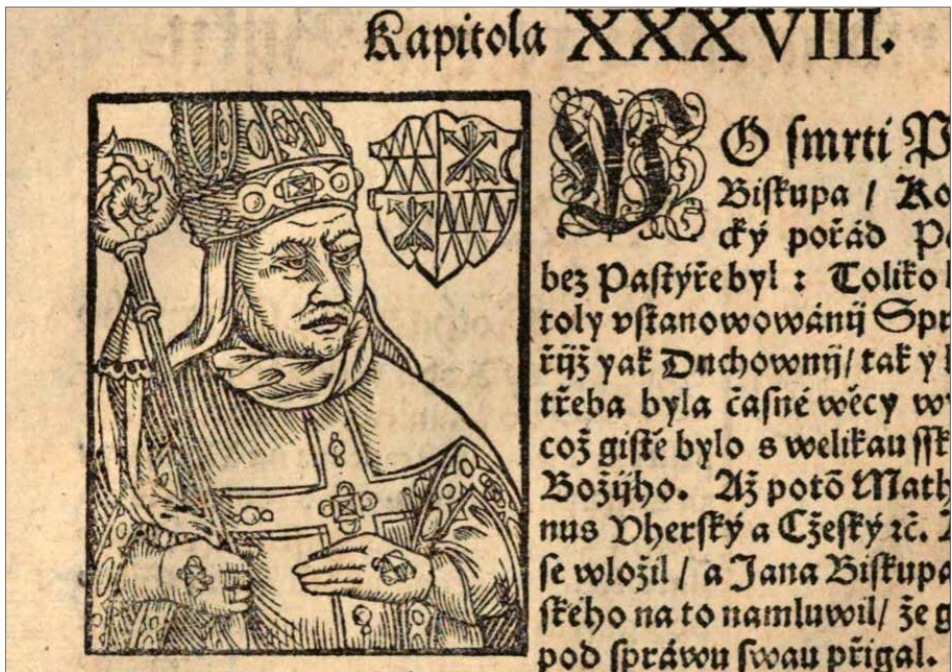
Obr. 9. Detail vyobrazení Jana Filipece s biskupským znakem. Podle Paprocký 1593.