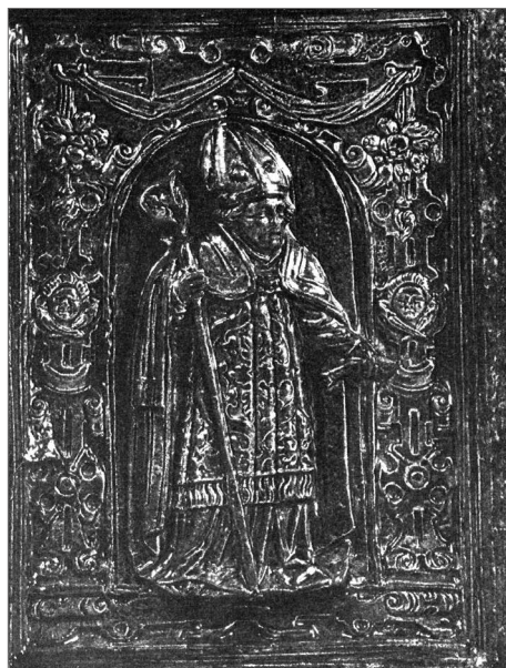
Obr. 11. Zeleně glazovaný reliéf s postavou biskupa a bohatou výzdobou z druhé poloviny 16. století z Kolína nad Rýnem. Podle Strauss 1972, II. Teil, 148, Tafel 135, Nr. 2.

Abb. 10. Heraldisches Motiv mit Bischofsensemble des Lübecker Bischofs Grimmolt (1510–1523) aus einem Museum in Lübeck. Nach Strauss 1972, II. Teil, 132, Tafel 78, Nr. 3.