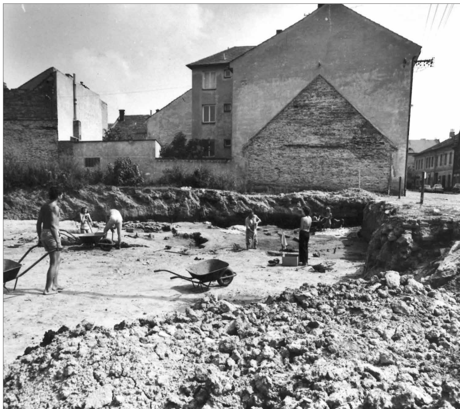
Obr. 2. Pohled na jižní polovinu zkoumané plochy (s objekty 2 a 7) na ulici Otakarově v roce 1979.