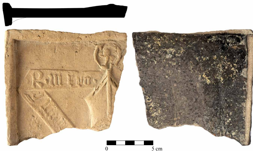
Obr. 5. Torzo kachle s motivem mitry, berly a nápisové pásky, inv. č. A 56085, z objektu 7. Přední a zadní strana. Foto T. Heřmánek, grafická úprava D. Menoušková.