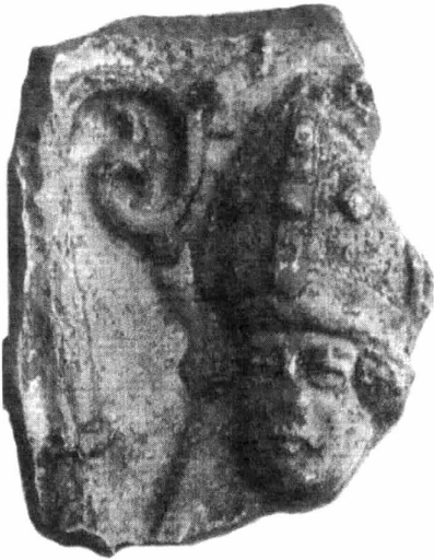
Obr. 15. Zeleně glazovaný fragment s reliéfem hlavy biskupa z hradu Varaždín. Podle Gruia 2013, 497, kat. 418.

Abb. 14. Teil des Reliefs einer Kachel mit dem Emblem von Erzbischof Jan Gruszczyński (1464–1473) mit Mitra, Kleeblattkreuz und Krummstab aus Gnesen. Nach Janiak 2003, 79, Katalog II.121.