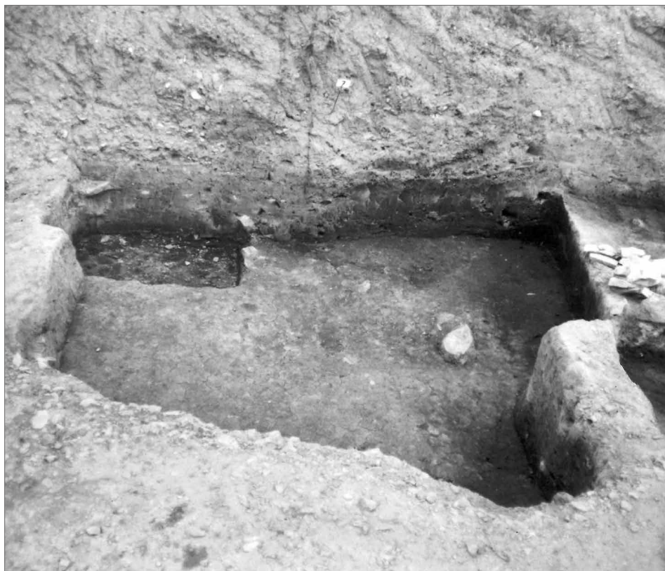
Obr. 4. Pohled na vypreparovaný objekt 7, odpadní jámu. Pohled od severozápadu, 1979.