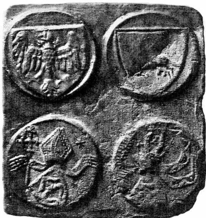
Obr. 12. Kachel se čtyřmi medailonky s heraldickými znaky, mezi nimiž je i znak arcibiskupa Jana Sprowského (1453–1464) z lokality Jankowo Dolne. Podle Janiak 2003, 75, katalog II.105.

Abb. 11. Grünglasiertes Relief mit Bischofsfigur und reicher Verzierung aus der zweiten Hälfte des 16. Jahrhunderts aus Köln am Rhein. Nach Strauss 1972, II. Teil, 148, Tafel 135, Nr. 2.