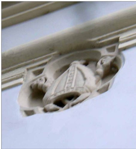
Obr. 18. Biskupská mitra na jižní, vnější straně presbyteria kostela při františkánském klášteře.