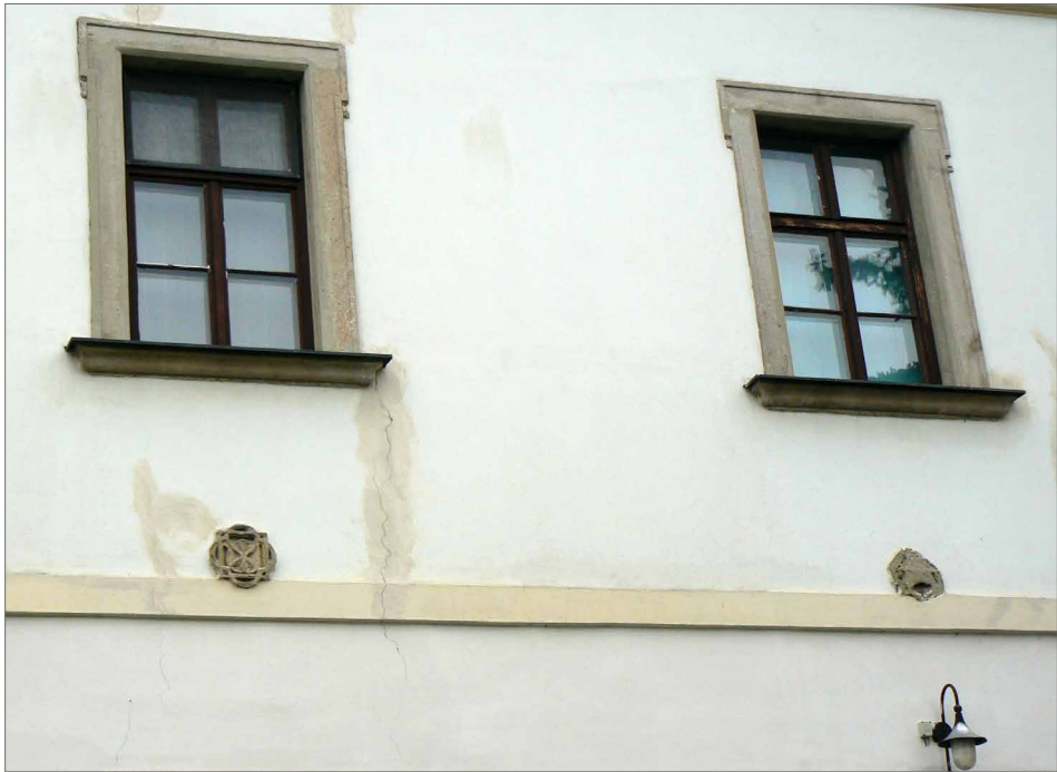
Obr. 17. Znak Jana Filipece a odznak biskupské mitry ve vnějším východním zdivu františkánského kláštera v Uherském Hradišti.