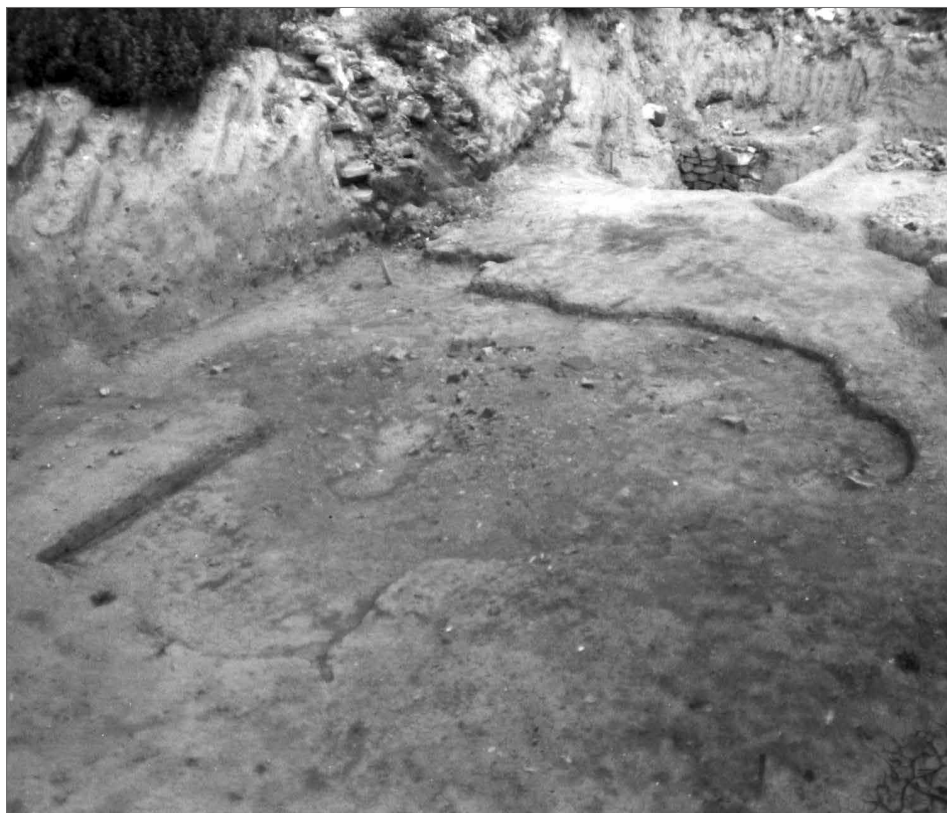
Obr. 3. Pohled na vypreparovaný objekt 2, středoviště nepravidelného tvaru. Pohled od západu, 1979.