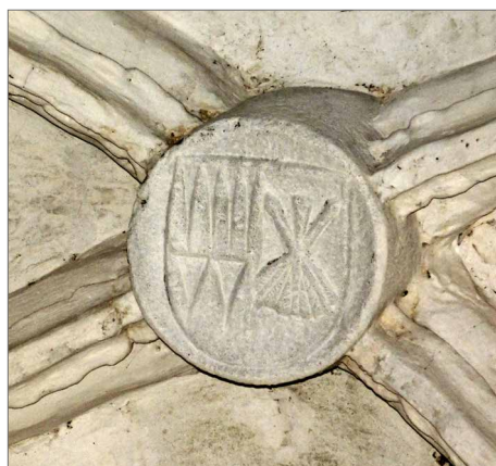
Obr. 20. Detail znaku Jana Filipce ze znakové galerie hradu Buchlov.

uherským panovníkem a českým králem. 7 Již v roce 1476 byl povýšen do šlechtického stavu a byl jmenován biskupem ve Velkém Varadínu (dnešní Oradea v Rumunsku), po smrti biskupa Tasa z Boskovic roku 1482 spravoval i olomouckou diecézi. V roce 1490 sehrál rozhodující roli při volbě Vladislava Jagellonského uherským králem, na biskupském místě se účastnil moravských zemských sněmů. Po korunovaci Vladislava Jagellonského v září 1490 rezignoval na všechny své politické i církevní posty. Když vypořádal svůj majetek, vstoupil 10. června 1492 ve Vratislavi do františkánského kláštera. Sympatizantem tohoto řádu, který zřejmě poznal během jeho expanze v Uhrách, byl však již dříve. 8 I v době, kdy se stáhl do ústraní, měl Filipec stále obrovskou autoritu a příležitostně jej