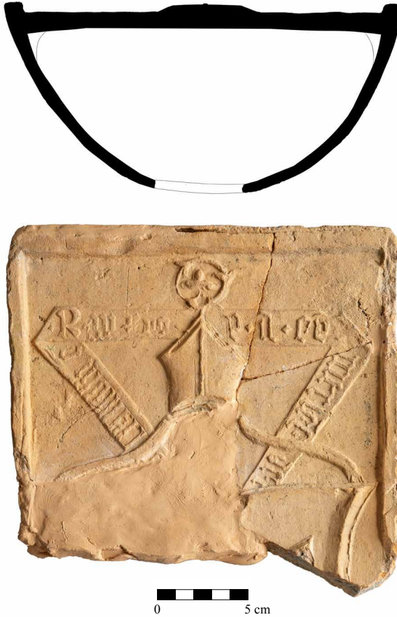
Obr. 6. Torzo kachle s motivem mitry, berly a nápisové pásky, inv. č. A 63471, z objektu 2. Foto T. Heřmánek, grafická úprava D. Menoušková.