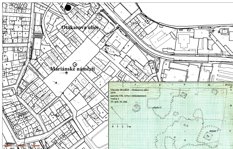
Obr. 1. Místo nálezů kachlů na výseku z mapy Uherského Hradiště a část plánové dokumentace výzkumu v Uherském Hradišti, Otokarově ulici. Vyznačeny objekty 2 a 7. Digitální úprava D. Menoušková.