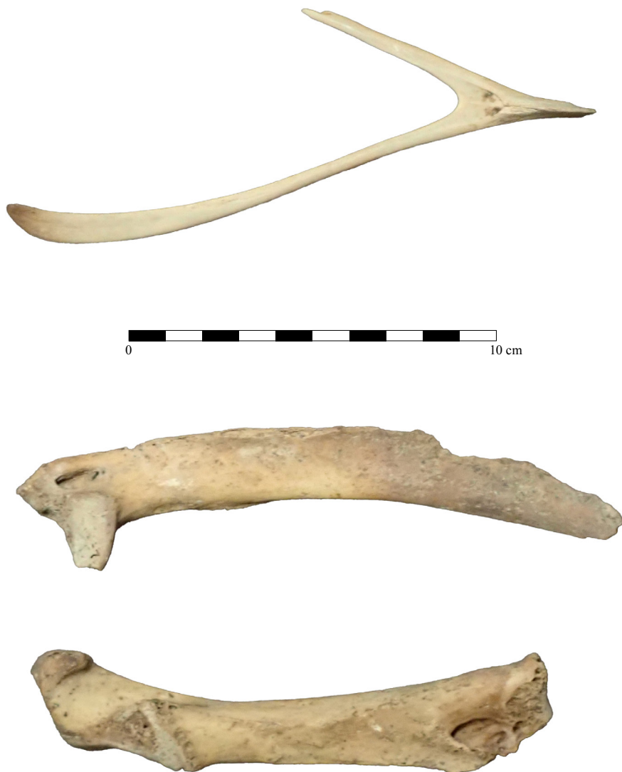
Obr. 3. Některé ptačí kosti z jímky čp. 289. Vlevo coracoid a scapula krocana, vpravo furcula páva. Autorka Zdeňka Sůvová. Abb. 3. Einige Vogelknochen aus Abwasserbecken Konskr.-Nr. 289. Links coracoid (Rabenbein) und scapula (Schulterblatt) eines Truthahns, rechts furcula (Gabelbein) eines Pfau. Autorin Zdeňka Sůvová.