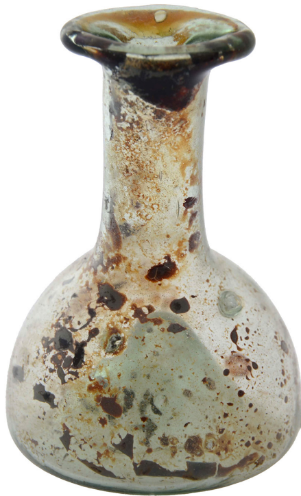
Obr. 4. Fotodokumentace lahviček s vysokým úzkým hrdlem. Foto ZČM, úprava Lenka Ornová.