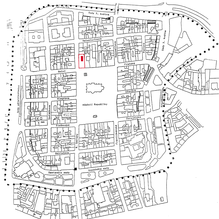
Obr. 1. Poloha čp. 289 v rámci historického jádra města Plzně. Autorka Veronika Kočí Dudková.