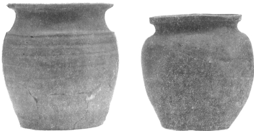
Obr. 2. Hrnce z Týnce n. S.

1971). Západně od rotundy byla zachycena sídlištní plocha s kúlovými objekty, jejíž nejstarší horizont je možno podle získaných nálezů zařadit rovněž do 11. věku. Severně od rotundy byly v místě mladšího kamenného objektu zachyceny stopy velké stavby s kúlovou konstrukcí. Z celkové situace prvotní sídlištní fáze lze soudit, že se po polovině 11. století stal Týnec významným sídlištním i mocenským centrem, jehož založení bylo součástí a spíše dovršením nejstarší fáze vnitřní kolonizace na dolním toku Sázavy, jejíž počátky můžeme položit nepochybně již do 10. věku. Situace týnecké ostrožny nad levým břehem Sázavy a její strategická poloha nad místem brodu dovoluje spolu s určitými