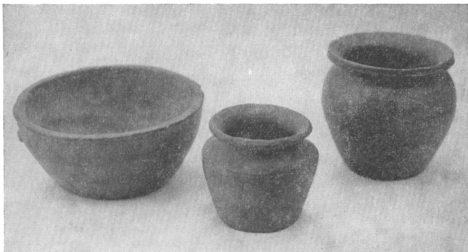
Obr. 1. Keramika z Týnce n. S.