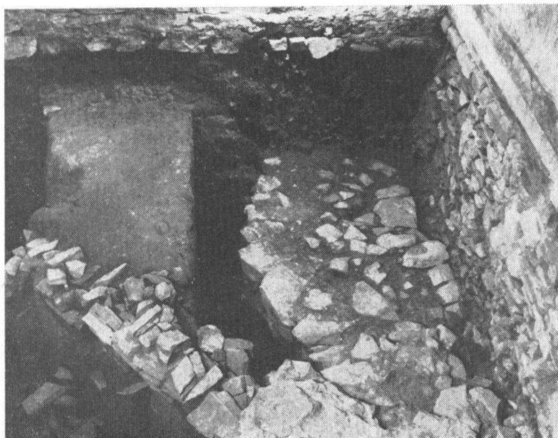
Obr. 2. Olomouc – dómské návrší 1984: Situace pod podlahou východního křídla býv. kapitulního děkanství (nyní Univerzita Palackého). Vpředu kamenná plenta na vnější straně mladohradištního valu. Vlevo zbytek hlinito-kamenitého tělesa valu. Vpravo obloukově závěr podélně orientované stavby (kaple sv. Maří Magdaleny?).