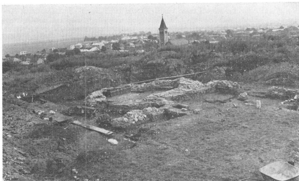
Obr. 2. Pohľad na rotundu.

pustiť, že mnohé práce a výrobky, bez ktorých sa nezaobíde každodenný život, si robili i sami príslušníci komunity (frátri). V materiálnej kultúre, ktorej zvyšky sme získali treba vidieť prejav kultúrnych prúdov od 12. až do konca 16. storočia. Získané výrobky a ich fragmenty dokazujú svojou technológiou výroby i umeleckým vkusom, že boli na úrovni zodpovedajúcej celému vtedajšiemu daniu na území Slovenska a v širších dimenziách celého Uhorska, či už ide o keramiky, kovové výrobky, kostené pamiatky a iné, ktoré sme na výskume získali.