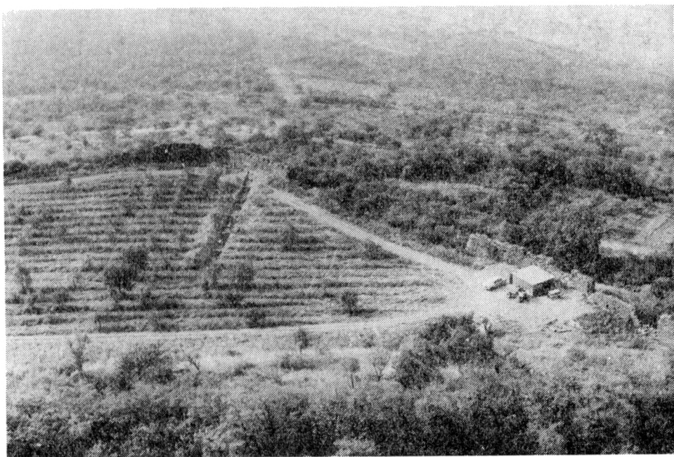
Obr. 3. Archeologická sondáž na spočinku jižního úpatí hradu Házmburku v r. 1989.