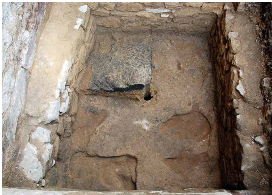
Obr. 3. Půdorys podlahy schodišťové věže.