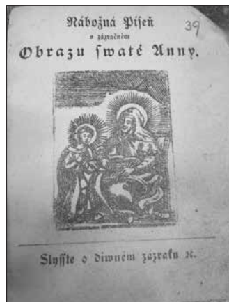
Obr. 3 10