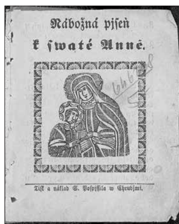
Obr. 5 12