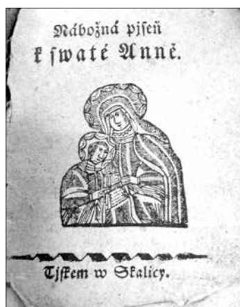
Obr. 4 11