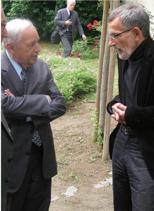
Obr. 3 Pierre Boulez v rozpravě s Miloše Štědroňem v Památníku Leoše Janáčka v Brně, 2009.

tonality a moderní modalita (Janáček totiž neuznával atonalitu, již nenašel v lidové písni), ale které se objevují u skladatelů „moderní“ či dokonce snad v poněkud transformované podobě i v kompozicích tzv. Nové hudby 60. let minulého století.