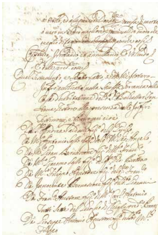
4 – Page 15 of Baldassare Fontana’s will, 17 th June 1733. Archivio di Stato del Cantone Ticino, Notarile, Ceppi 2029