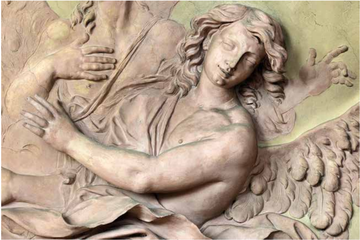
2 – Baldassare Fontana, Stucco decoration , 1702. Hradisko near Olomouc, Premonstratensian canonry, Library hall

of his assets, which became necessary for inheritance reasons that will be discussed below, written up by a notary in 1737, 8 after their son Francesco's death, designated universal heir according to the inheritance system in force. [Figs. 5, 6] The two documents, in different capacities, introduce new ways of completing the information we have regarding his life; his affective relations, which can't be neglected in order to investigate certain dynamics of the society to which Fontana belonged; already known or possible workshop relations; socio-economic relations developed through his marriage to a woman from the mercantile bourgeoisie of this border town.