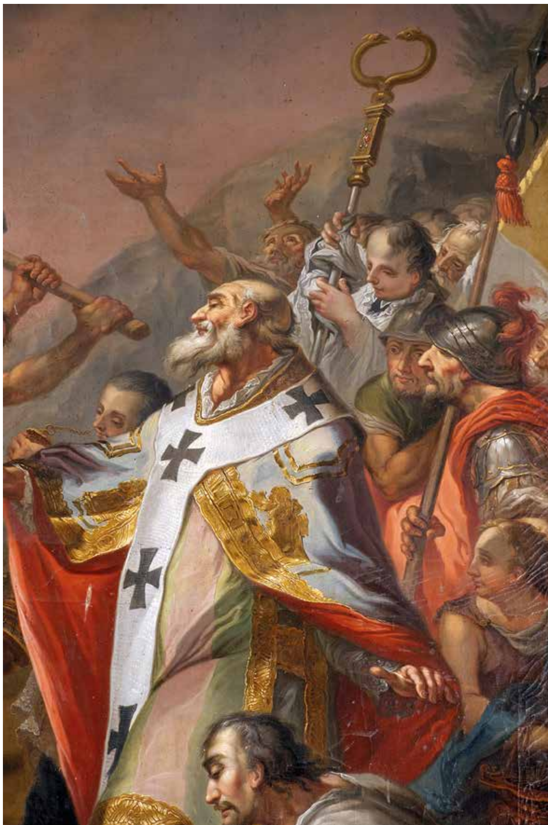
2 – Franz Schön, Druhé povýšení svatého Kříže (detail), 1809. Žiar nad Hronom, kostel sv. Kříže