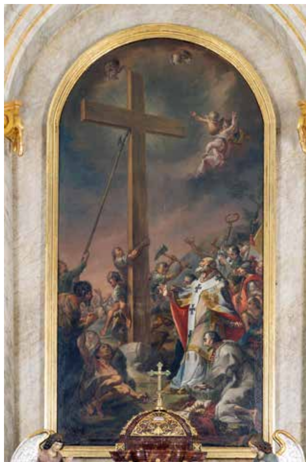
1 – Franz Schön, Druhé povýšení svatého Kříže , 1809. Žiar nad Hronom, kostel sv. Kříže

V dějinách umění na Slovensku patří tato generace malířů z hlediska poznání a interpretace k jedním z problematičtějších skupin. O životech individuálních malířů se něco málo dozvídáme z ojedinelých zmínek ve fragmentárně zachovaných archivních dokumentech nebo v tisku, přičemž téměř zcela chybí vizuální materiál dokládající jejich praktickou činnost. Přesto však nezůstali zcela bez povšimnutí. Odborný diskurz o významu lokálních uměleckých osobností pro kulturní rozvoj města začal brzy – na přelomu 19. a 20. století, poháněn výrazným zájmem nastupujících osobností dějin umění v Bratislavě, stimulován také prešpurským lokálním patriotismem (Lajos Kemény, Gisela Weyde) 4 a později, po roce 1950, cíleně veden předními historiky umění ze slovenského, maďarského a českého prostředí (Klára Garas, Endre Csatkai, Viera Luxová, Anna Petrová-Pleskotová, Mária Pötzl-Malíková, Petr Fidler). 5 Jelikož měl výzkum v podstatě povahu datového sběru – excerpcování dobových zdrojů s důrazem na matriční a daňové záznamy a současný tisk –, jeho publikované výstupy mají převážně formu slovníků. Zřídka bylo možné přistoupit k jejich určité syntetizaci do ucelenějších, i když ne nutně spolehlivých seznamů, 6 nebo k rekonstrukci zjištění do případových studií, které se však týkají spíše z vědeckého hlediska „zajímavějších“ starších současníků poslední barokní generace,