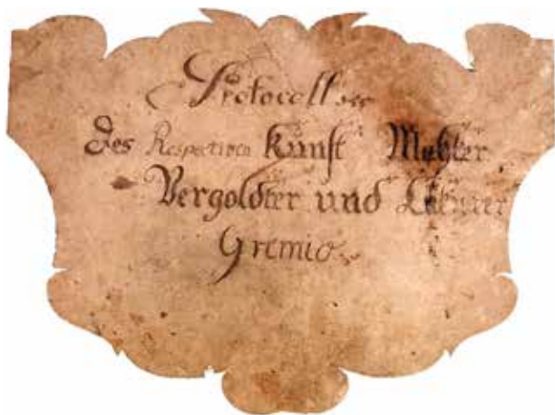
5 – Obálka protokolů Grémia malířů, pozlacovačů a lakýrníků, 1800–1806. Archív mesta Bratislavy

ve vrcholném tereziánském období. Například Nikolaus Fischer st. vlastnil nemovitost ve starém předměstí; 67 také evangelík Friedrich Laurentius Kamauf (1725–1793), syn známějšího Oeserova učitele Emerica Friedricha Kamaufa, vlastnil „dům sestávající z 10 pokojů, 10 komor, z nichž vícere jsou klenuté, 1 liovny včetně jednoho velkého lisu, s přílehlou [...] loukou a 1 ovocným sadem na Mlynské nivě“ v Laurinské ulici. 68 V roce 1760 byl Kamauf dokonce členem vnější městské rady, 69 což dále dokazuje vysoké společenské postavení malířů ve struktuře města ještě v polovině 18. století. V době přibližně mezi lety 1780–1825 se obdobně dařilo pouze malířům hracích karet. Relativně vysoká výše daňových porcí Johanna Gröschla (cca 1741–1791) nebo Josepha Böhma (* cca 1754) 70 reflektuje jejich nemovitý majetek a zároveň indikuje stabilní příjem a enormní prestiž tohoto povolání. Gröschl a Böhm vlastnili domy přímo v městském jádru a zastávali ve městě vysoké formální pozice. Böhm byl v roce 1825, stejně jako Kamauf, členem vnější městské rady. 71 Naopak, z kolektivu zkoumaných malířů zatím neznáme jediného, který by ve společenské struktuře města vystoupil tak vysoko. Na začátku 19. století však daňové záznamy ukazují určitý nárůst příjmů některých jednotlivců, který by bylo přínosné prozkoumat.